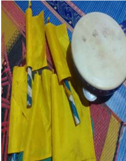
(Bendera dan Terbang yang digunakan dalam pelaksanaan tradisi Baayun Maulid )