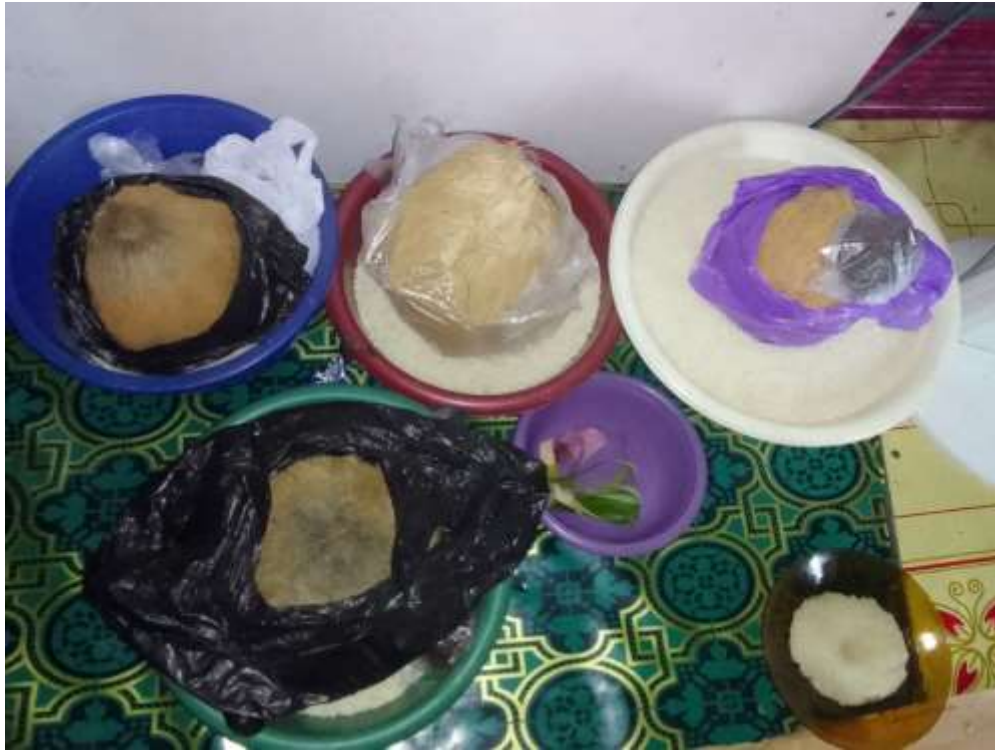
( Piduduk yang disediakan untuk acara pelaksanaan Baayun Maulid di Desa Podok)