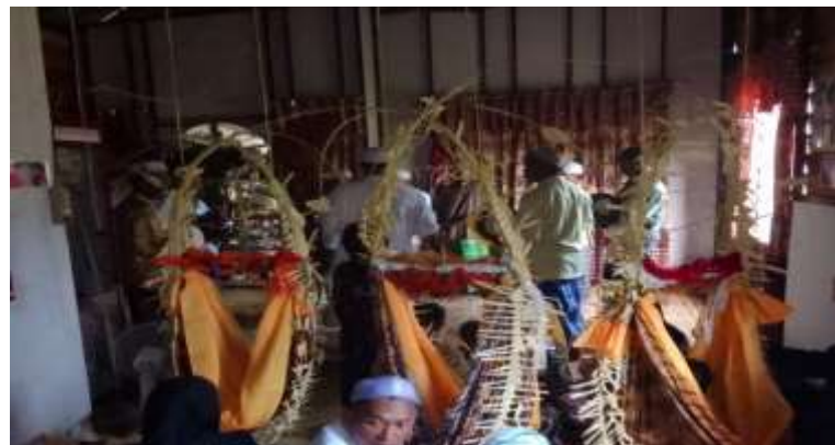
(Anyaman yang digunakan dalam proses pelaksanaan tradisi Baayun Maulid di Desa Podok)