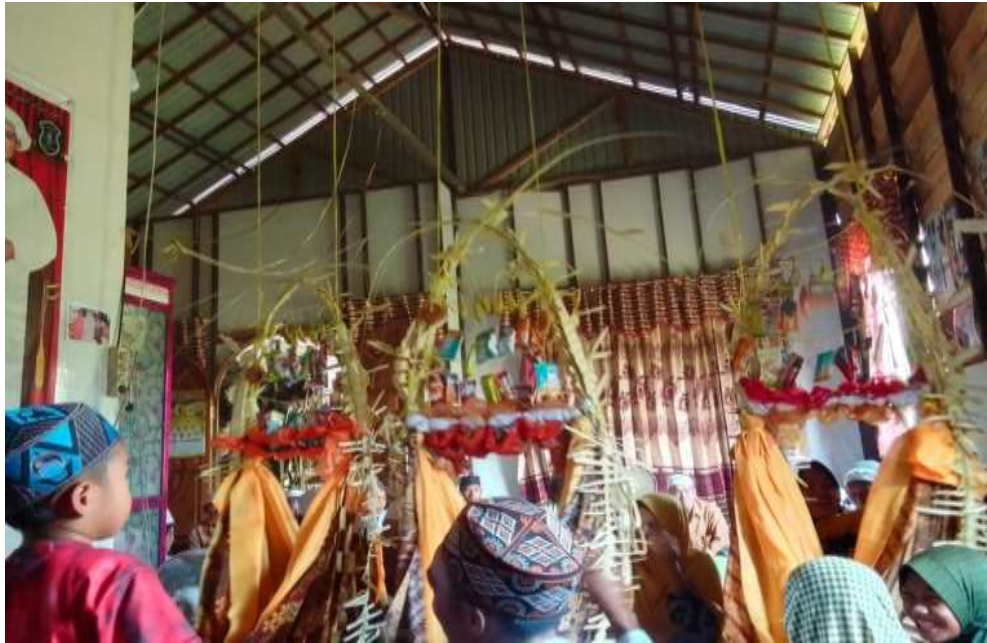
(Pelaksanaan Tradisi Baayun Maulid di rumah Ibu Rahmah, Jum'at, 29 September 2023)