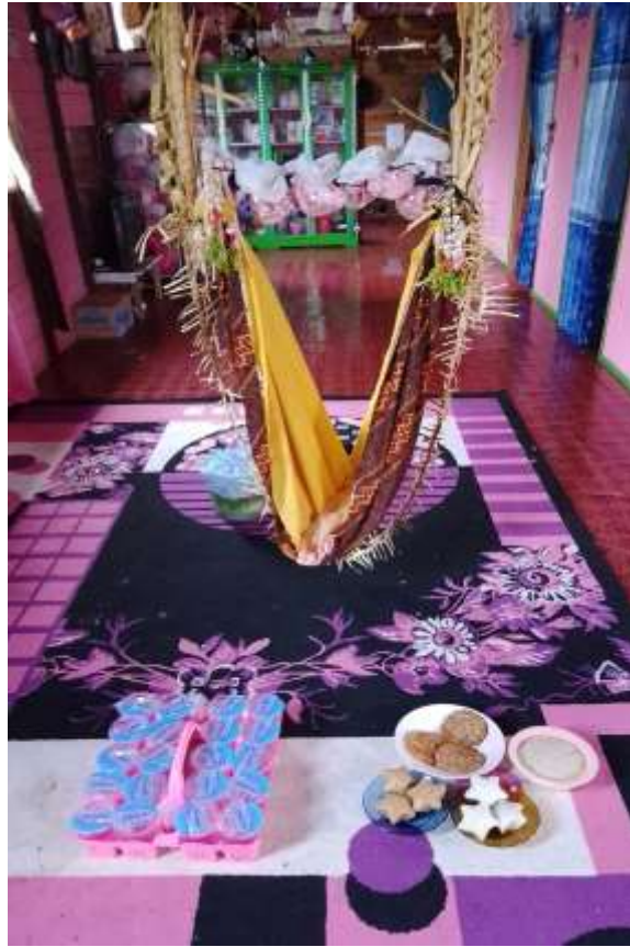
(Ayunan yang dihiasi dengan anyaman, serta makanan yang digantung dalam pelaksanaan tradisi Baayun Maulid di Desa Podok)