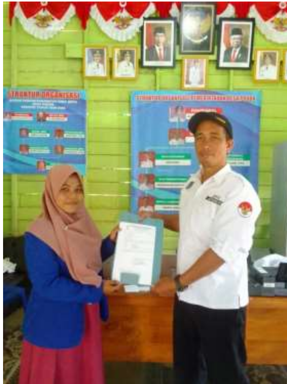
(Penyerahan Surat Izin Riset Kepada Pembakal Desa Podok)