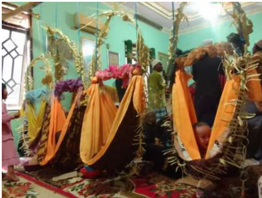
(Ayunan yang dilapisi dengan kain kuning , tapih bahalai , dan tapih sarigading )