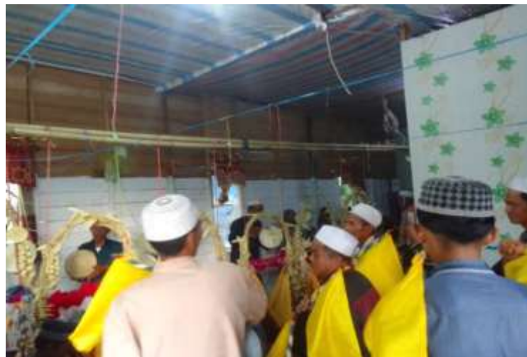
(Pelaksanaan berudat dalam tradisi Baayun Maulid di Desa Podok)