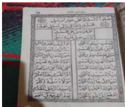
(Kitab Syaraful Anam dan syair-syair yang dibaca dalam pelaksanaan tradisi Baayun Maulid di Desa Podok)