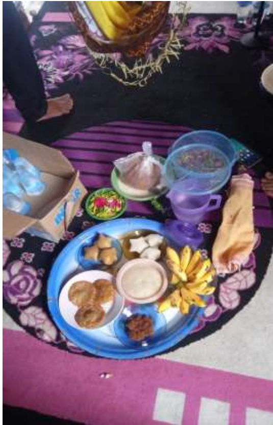
(Wadai cucur, wadai lekatan, dan wadai apam yang disiapkan untuk pelaksanaan tradisi Baayun Maulid )