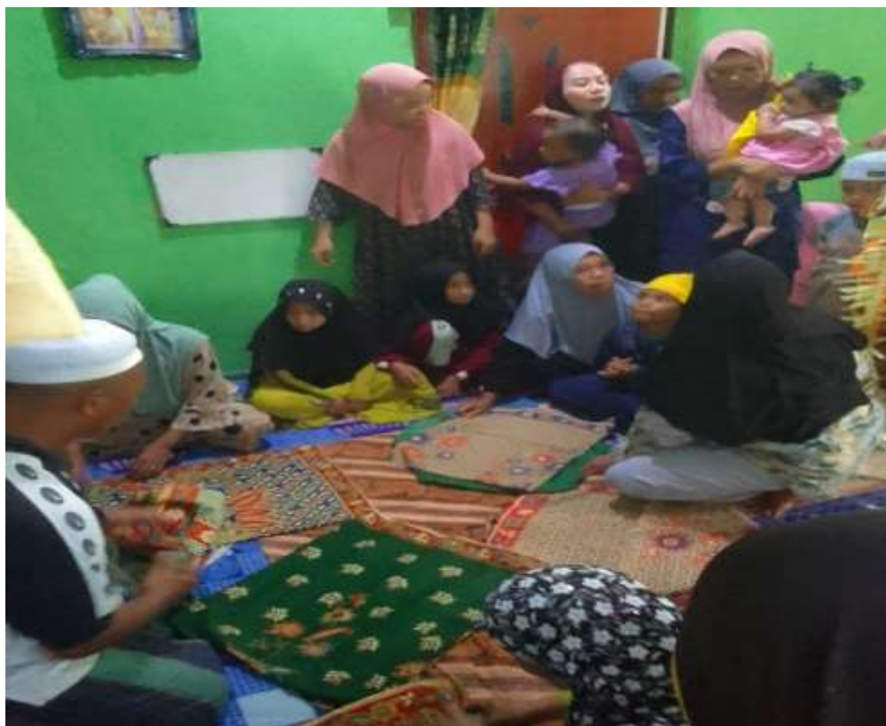
(Pelaksanaan Batumbang Apam dalam tradisi Baayun Maulid )