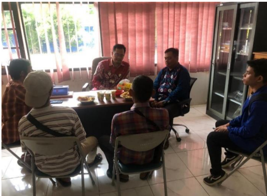
proses pasca rehab terhadap klien