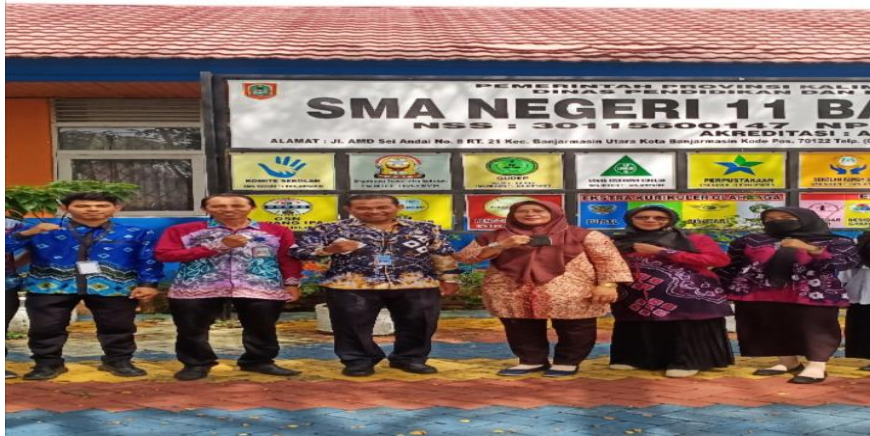
Foto bersama dengan Konselor Narkoba setelah kegiatan sosialisasi di Sma Negeri 11 Banjarmasin