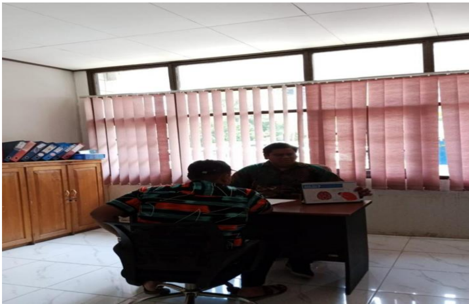
wawancara dengan informan 1