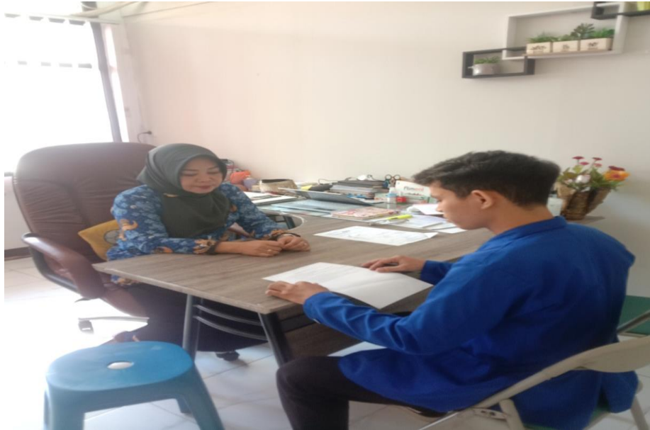
wawancara dengan informan II