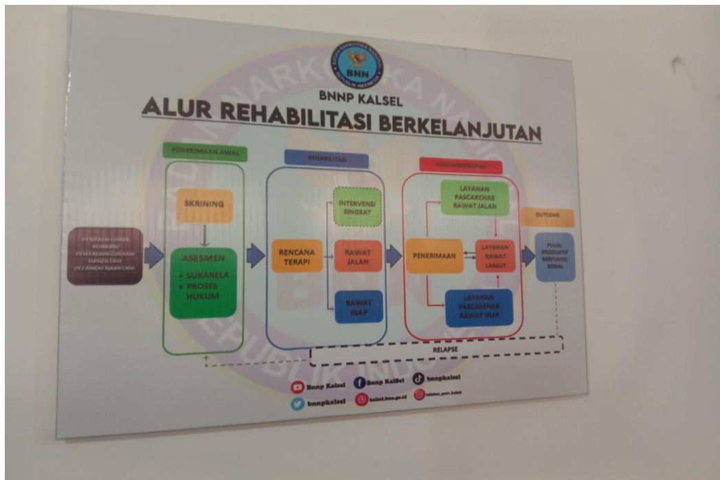
Gambar 4. 2 Alur Rehabilitasi Berkelanjutan