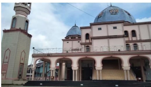
Gambar 4.6 Mesjid Jami Abdurrahim Muara Teweh