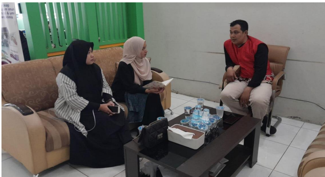
Gambar. 4 Wawancara Dengan Karyawan PT Maali Wisata