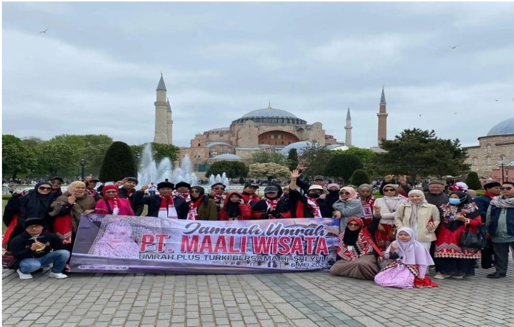
Gambar. 1 Jemaah Umroh Plus Turki