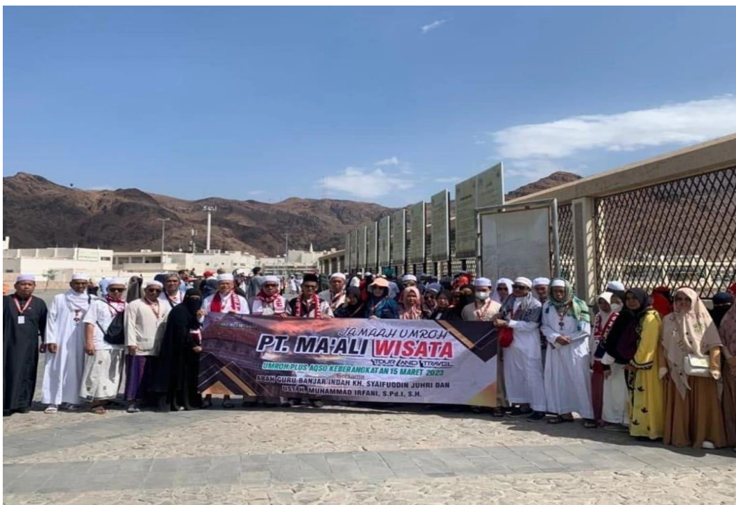
Gambar. 2 Jemaah Umrah Plus Aqso