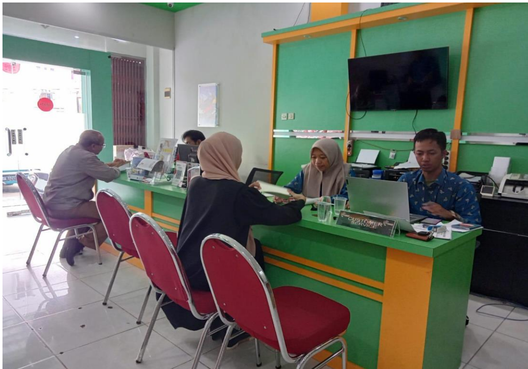
Gambar.3 Wawancara Dengan Karyawan PT Maali Wisata