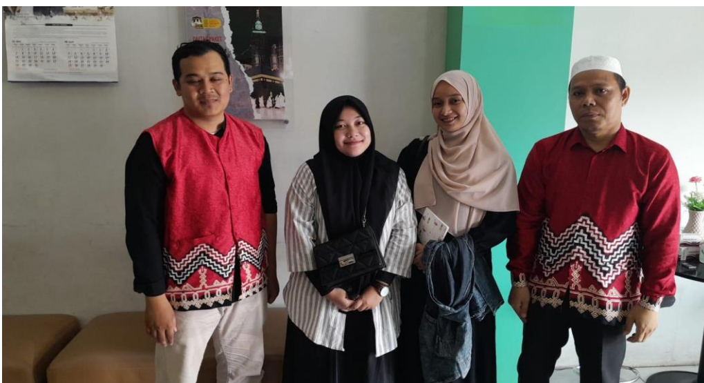
Gambar. 6 Bersama Bagian Keuangan dan Pembina di PT Maali Wisata