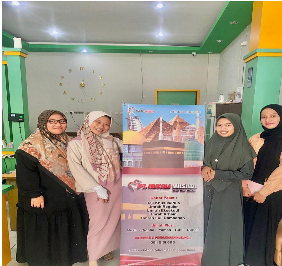
Gambar. 5 Bersama Manajer Operasional Dan Bagian Pemasaran PT Maali Wisata