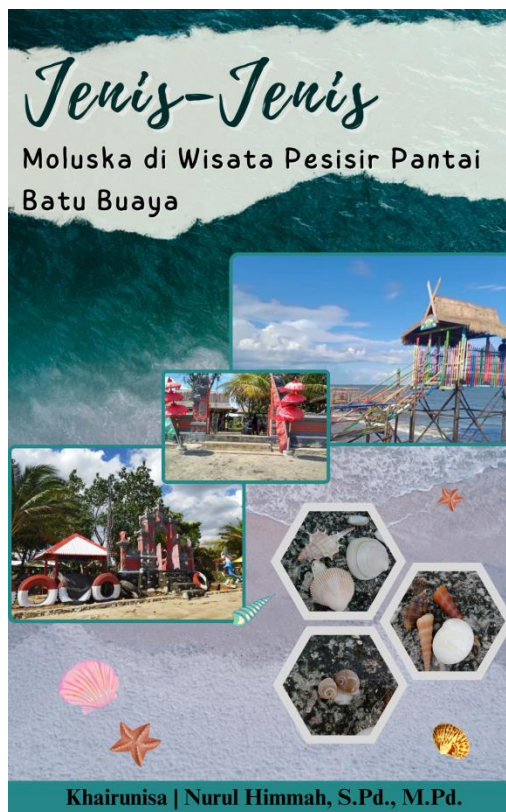
Gambar 3.1 Cover Buku Ilmiah Populer