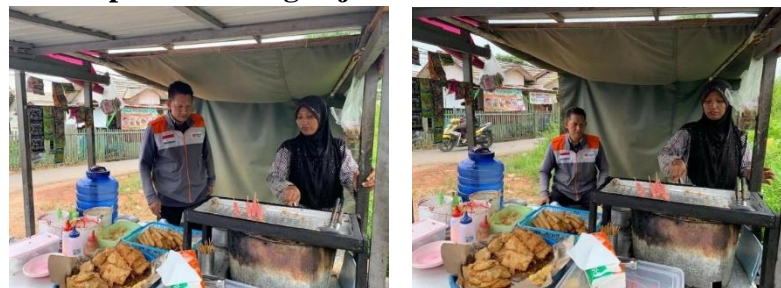
Gambar 4.2 Monitoring Pihak Rumah Zakat kota banjarmasin terhadap Usaha Yang Dijalankan Mustahik.