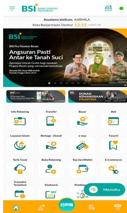
GAMBAR 4 . 2 Aplikasi Mobile Banking BSI

Perkembangan teknologi dan tuntutan kebutuhan masyarakat yang kian kompleks telah mendorong BSI untuk melakukan inovasi layanan pada BSI mobile. Seperti fitur-fitur yang ada didalam aplikasi BSI mobile banking itu sendiri serta tata cara melakukan sebuah transaksi perbankan maupun informasi lainnya yang ada di dalamnya.