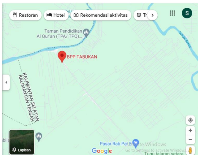
Gambar II google maps kebun sawit