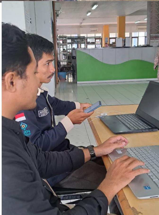
Mengisi Kuesioner Bersama Mahasiswa UIN Antasari Banjarmasin