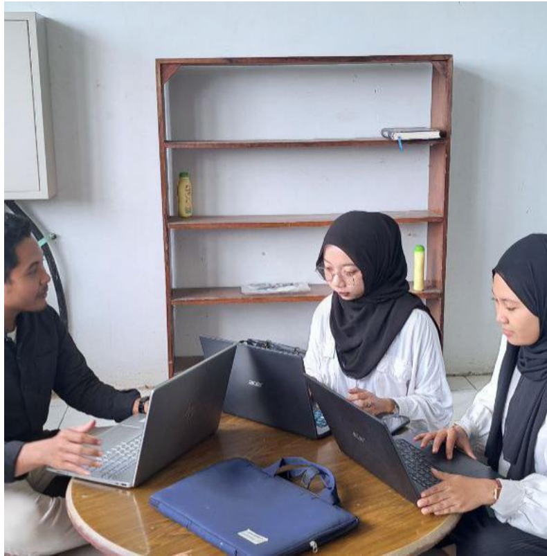
Mengisi Kuesioner Bersama Mahasiswa UIN Antasari Banjarmasin