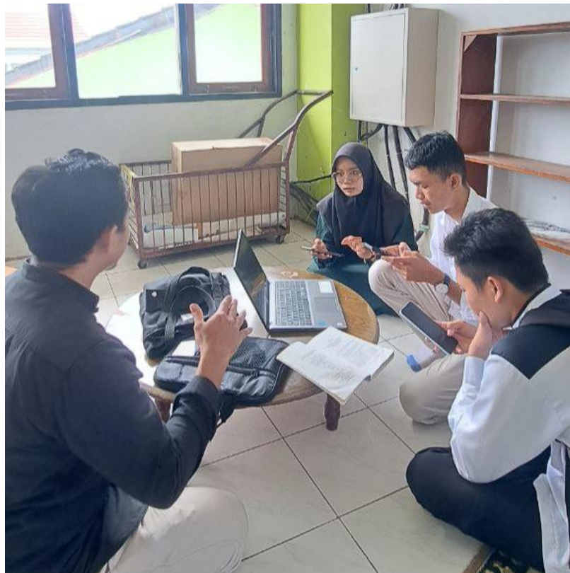
Mengisi Kuesioner Bersama Mahasiswa UIN Antasari Banjarmasin