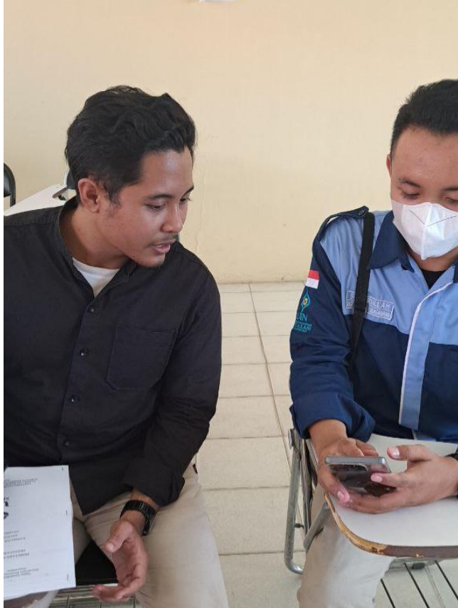
Mengisi Kuesioner Bersama Mahasiswa UIN Antasari Banjarmasin