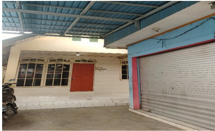
Gambar 5.1 Tempat Pembelajaran di Rumah Sekretariat Jalan Saka Pemail