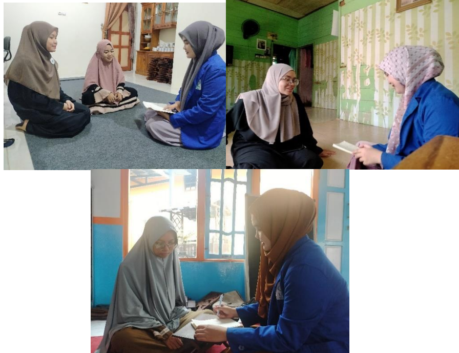
Gambar 5.5 Wawancara dengan Kakak Pengajar Komunitas Mengajian.Si