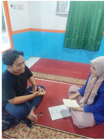
Gambar 5.4 Wawancara dengan Founder sekaligus Ketua Komunitas Mengajian.Si