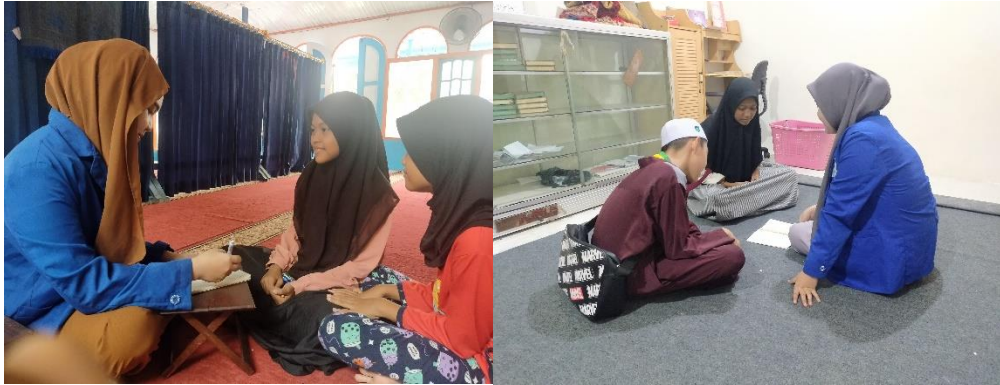
Gambar 5.6 Wawancara dengan Peserta Didik Komunitas Mengajian.Si