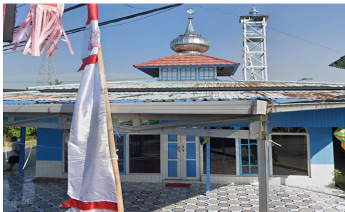
Gambar 5.3 Tempat Pembelajaran di Langgar Al-Ikhsan Jalan Banyuur Luar