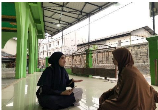
Gambar 5.7 Wawancara dengan Orangtua Peserta Didik Komunitas Mengajian.Si