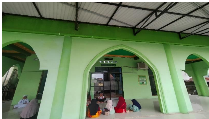
Gambar 5.2 Tempat Pembelajaran di Masjid Al-Wathaniyah Jalan Ampera Gang.20