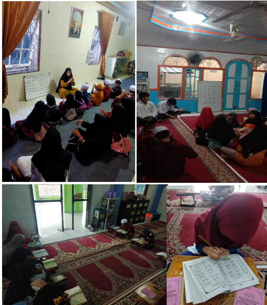
Gambar 5.8 Kegiatan Pembelajaran Al-Qur'an Komunitas Mengajian.Si