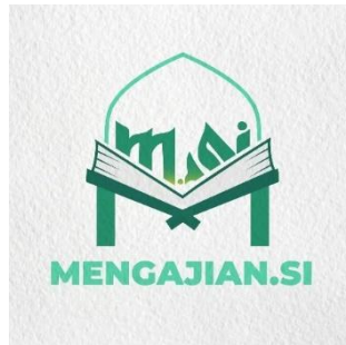
Gambar 4.1 Logo Komunitas Mengajian.Si

Komunitas Mengajian.Si adalah sebuah komunitas yang di dalamnya terdiri dari sekumpulan remaja yang berada di kota Banjarmasin yang mempunyai latar kehidupan dan potensi diri yang beraneka ragam akan tetapi berkolaborasi untuk mencapai tujuan bersama yakni belajar dan mengajar sebagai sarana untuk menuntut ilmu yang menyenangkan terlebih utama ilmu agama, berjiwa social entrepreneur dan open minded tentang teknologi. Komunitas Mengajian.Si mempunyai tiga tempat pembelajaran yang aktif yaitu di Jalan Saka Permai Belitung Selatan, di Jalan Banyuur, dan di Jalan Ampera Gang 20. Adapun kegiatan ini dilaksanakan setiap tiga kali pertemuan dalam seminggu di sore hari dan kegiatan pembelajarannya meliputi mengaji, materi islami seperti tajwid, fiqih, akhlak dan sejarah islam serta kegiatan tambahan seperti menghafal surah-surah pendek dan doa-doa harian.