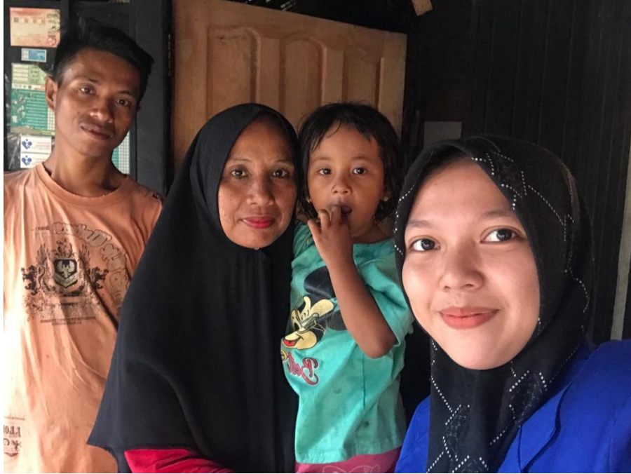
Pasangan III : Bapak AS dan Ibu M, Pasangan Penyandang Disabilitas Tunadaksa (suami) dan Tunawicara (istri)