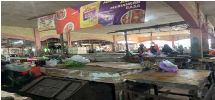
Tempat pedagang ikan (kosong)