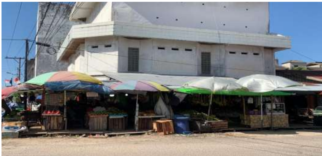
Pedagang buah dan sembako