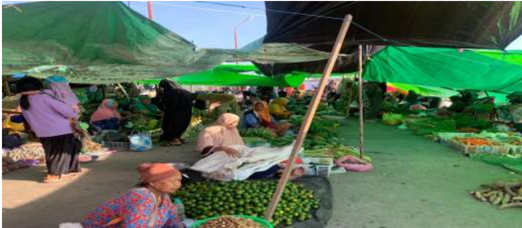
Pedagang sayur dan buah