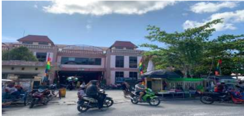
Gambar Pasar tampak depan Pasar H. Umar Hasyim