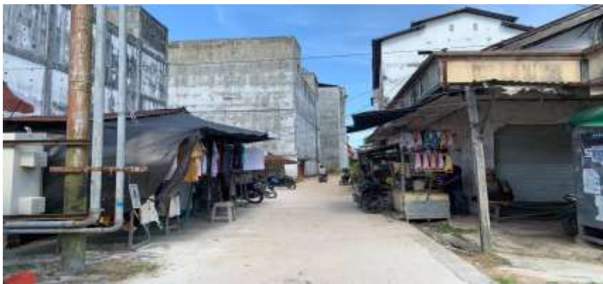
Lahan rencana pembuatan tempat pedagang kaki lima