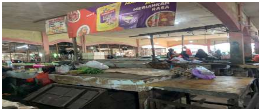
Tampak tempat-tempat kosong