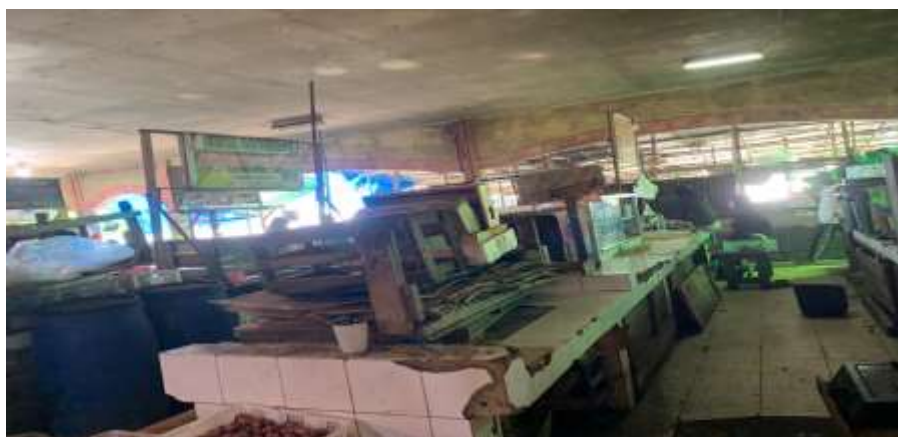
Tempat pedagang sayur (kosong)