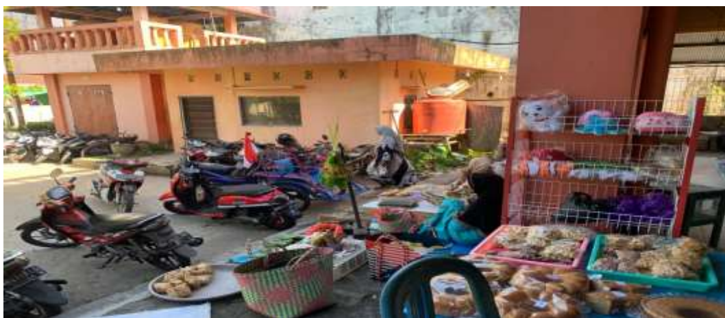
Pedagang ikan dan sayur