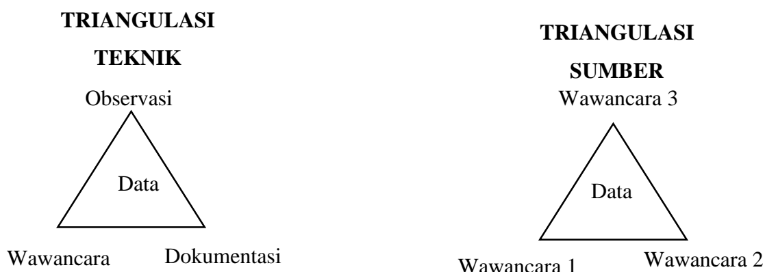
Gambar 3.2 Teknik Triangulasi

Dalam penelitian ini, peneliti melakukan uji kredibilitas dengan triangulasi, triangulasi dilakukan dengan triangulasi tehnik, dan triangulasi sumber peneliti menggunakan triangulasi tehnik, karena pada penelitian ini teknik pengumpulan data menggunakan observasi, wawancara, dan dokumentasi, namun ada beberapa hal juga yang tidak dapat diobservasi serta didokumentasikan, maka dari itu peneliti juga menggunakan triangulasi sumber untuk mengetahui kebenaran data penelitian. Untuk lebih jelas dapat dilihat dalam gambar berikut 39