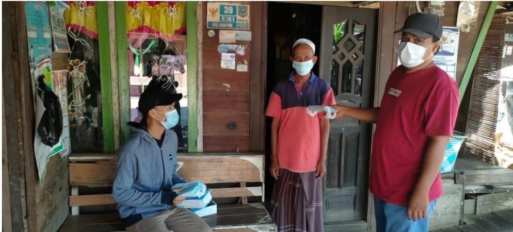
Dokumentasi Desa Hamayung pada saat pembagian masker kepada warga Hamayung untuk mencegah penyebaran Covid-19 di Desa Hamayung