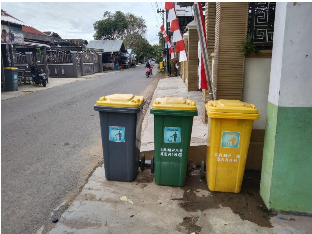
Tempat sampah dari desa Hamayung terletak di samping Gerbang Sekolah Madrasah Ibtidaiyah Negeri 18 Hulu Sungai Selatan