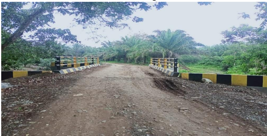
Gambar 4.15 Jembatan Beton Pemalongan

Pada tahun 2023, Selain pembangunan jalan, desa pemalongan juga diberi bantuan pembangunan jembatan. Keberadaan jembatan baru ini memberikan bantuan signifikan bagi aktivitas masyarakat dan karyawan dari Desa Pemalongan, Jembatan ini telah selesai dikerjakan dengan total biaya sebesar Rp 352.000.000. terutama mengingat jembatan sebelumnya mengalami kerusakan.