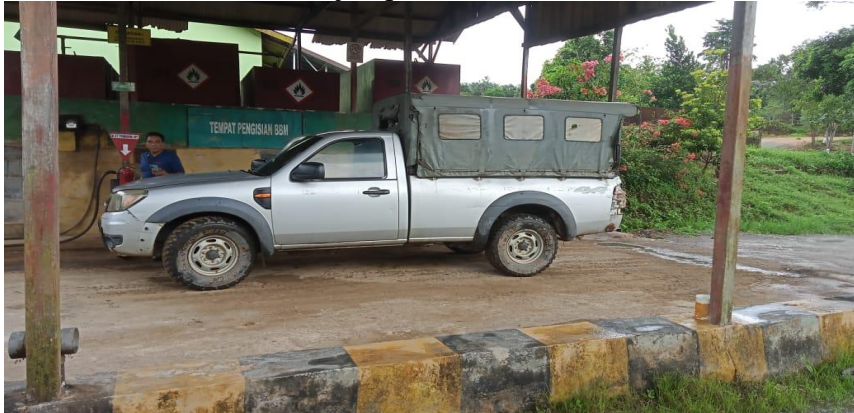
Gambar 4.12 Mobil antar jemput murid TK dan Guru