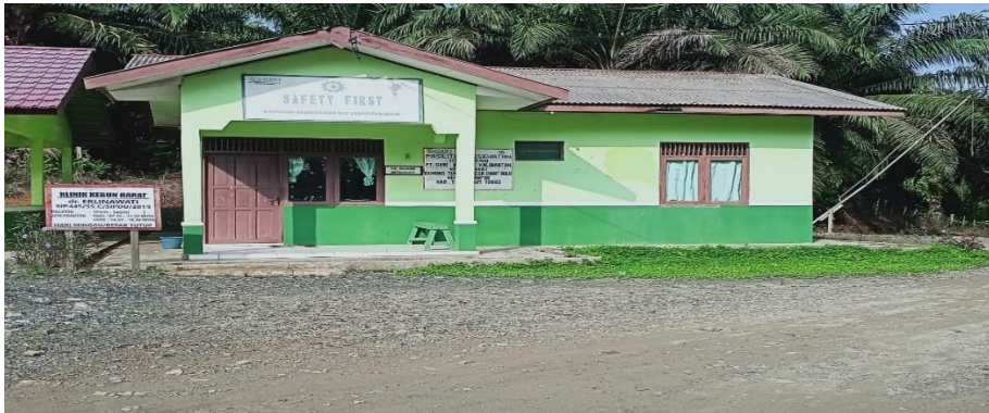
Gambar 4.8 Klinik dan Ambulans PT. Gawi Makmur