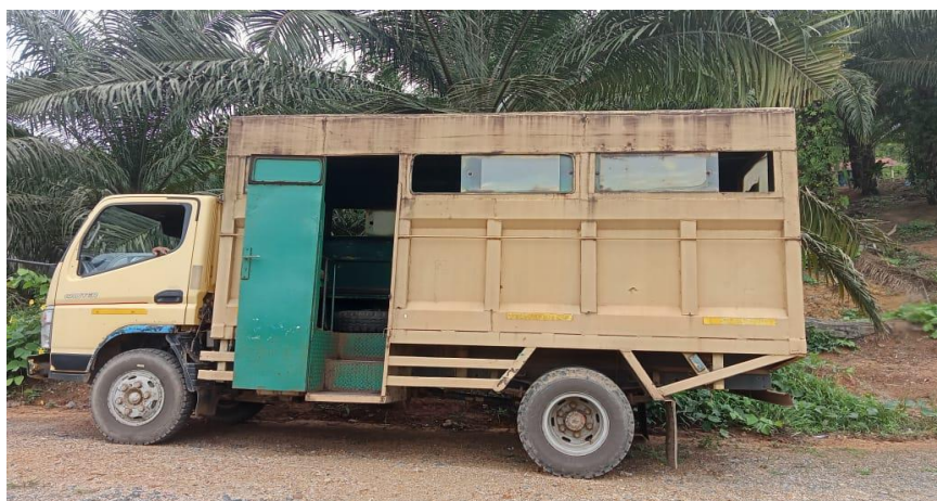
Gambar 4.11 Mobil antar jemput murid SD dan SMP

yaitu di pos depan kantor ceklok. Setelah mengantar murid SD barulah kemudian menjemput murid yang sekolah SMP Negeri 3 Batu Ampar, yang kemudian diantar pulang ke titik kumpul mereka tadi dijemput. Untuk mobil antar jemput anak SD dan SMP ini sebenarnya diadakan untuk masyarakat internal perusahaan tetapi fakta dilapangan adalah murid dari Desa Damit Hulu yakni desa terdekat dengan perusahaan juga ikut menggunakan mobil ini sebagai transportasinya untuk bersekolah di SMP 3 Batu Ampar.