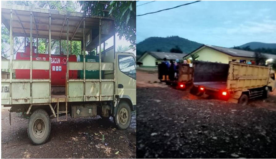
Gambar 4. 10 Mobil antar jemput pegawai dan spraying system