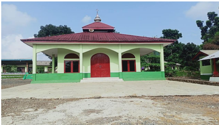
Gambar 4.4 Musala Az-Zahra PT. Gawi Makmur

Perusahaan berusaha untuk bisa menjangkau semua bidang dalam melaksanakan CSR-nya, termasuk bidang keagamaan. Pada lingkungan perusahaan, musala sangat diperlukan sebagai sarana bagi masyarakat yang tinggal di lingkup perusahaan untuk beribadah, merayakan hari-hari besar, maulid dan sebagainya. Dan berdasarkan data yang diperoleh dilapangan, mayoritas masyarakat atau pegawai yang ada lingkungan perusahaan adalah beragama Islam. Melihat hal ini perusahaan memprogramkan pembangunan musala sebagai program CSR Perusahaan.