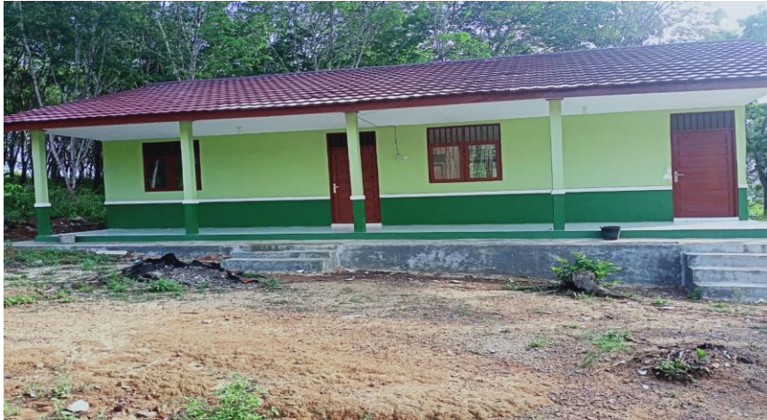
Gambar 4.14 Lokal TK Melati