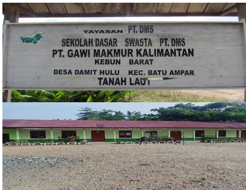
Gambar 4.6 Sekolah Dasar Swasta PT. Gawi Makmur

Bidang pendidikan adalah salah satu bidang yang juga menjadi sasaran bagi PT. Gawi Makmur dalam menjalankan program CSR-nya. Melihat fakta dilapangan bahwa banyak anak-anak yang tinggal di lingkungan perusahaan terlebih lagi apabila ada rekrutmen pegawai baru, pegawai tersebut rata-rata yang sudah berkeluarga dan memiliki anak. Berdasarkan pertimbangan ini perusahaan berusaha untuk memberikan sarana belajar khusus bagi anak-anak para pegawai, maka diprogramkanlah pembangun sekolah dasar swasta. Pembangunan ini dilakukan agar anak-anak bisa mengenyam pendidikan dengan nyaman tanpa perlu keluar dari lingkungan perusahaan yang mana memerlukan waktu yang lama karena jaraknya yang jauh.