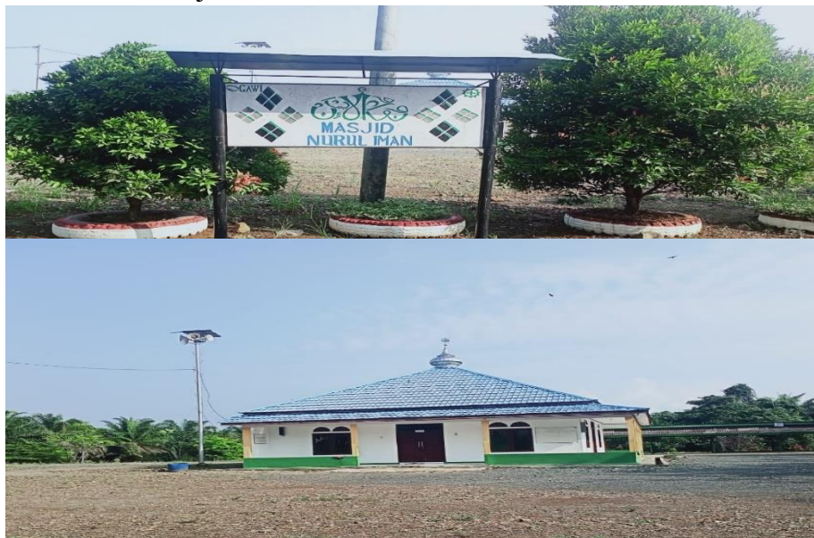
Gambar 4.5 Masjid Nurul Iman PT. Gawi Makmur

Setelah membangun Musala melalui program CSR, hal ini masih belum bisa memfasilitasi kaum muslim untuk bisa menjalankan ibadah dengan maksimal, yaitu belum adanya masjid. Wajib bagi seorang pria muslim diwajibkan untuk menunaikan shalat jum'at, yang biasanya diadakan di masjid. Sebelumnya masyarakat perusahaan yang berniat untuk menunaikan shalat jum'at harus keluar menuju desa terdekat untuk bisa shalat di masjid yang ada di desa, jarak dari perusahaan ke masjid desa terdekat juga cukup jauh yaitu 5 KM dan ini cukup memakan waktu. Oleh karenanya menanggapi hal ini perusahaan memutuskan untuk membangun masjid di lingkungan perusahaan untuk memudahkan masyarakat perusahaan khususnya laki-laki dalam melaksanakan ibadah shalat jum'at