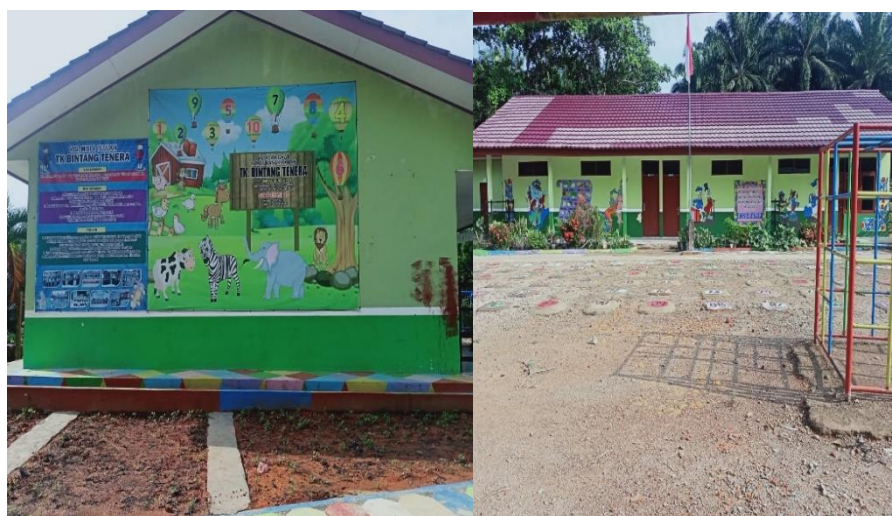
Gambar 4.7 TK. Bintang Tanera

Disamping pembangunan sekolah dasar perusahaan juga turut andil memberikan pendidikan bagi anak usia 4-6 tahun. Perusahaan membangun TK untuk anak-anak bisa mengenyam pendidikan bukan hanya SD tetapi juga TK. TK yang dibangun dengan program CSR perusahaan ini bernama TK Bintang Tanera.