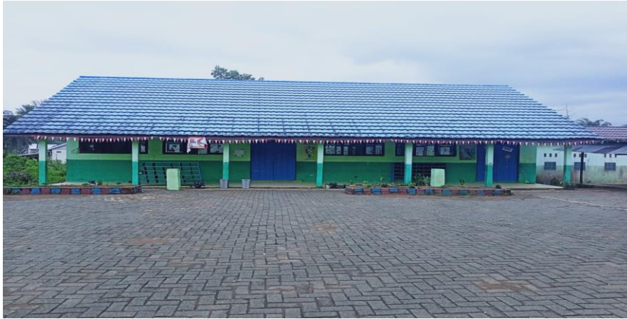
Gambar 4.20 Lokal SD Damit 4