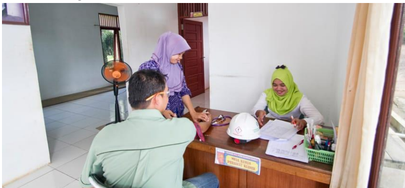
Gambar 4.13 Donor Darah

Kegiatan donor darah ini merupakan kegiatan rutin tahunan yang diadakan PT. Gawi Makmur. Hal ini sebagai nilai perusahaan ( Corporate Value ) yakni peduli terhadap sesama ( Care for People ). Adapun tujuan dari kegiatan ini adalah untuk membantu unit transfusi darah yakni Palang Merah Indonesia (PMI) Kabupaten Tanah laut, selain dengan mendonorkan darah perusahaan juga ingin meningkatkan rasa kepedulian sosial dari pegawai PT. Gawi Makmur agar lebih termotivasi untuk berbagi dan memberikan bantuan kepada sesama.