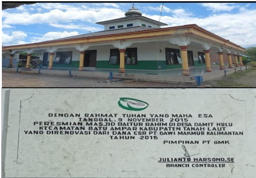
Gambar 4.18 CSR Masjid baiturrahim