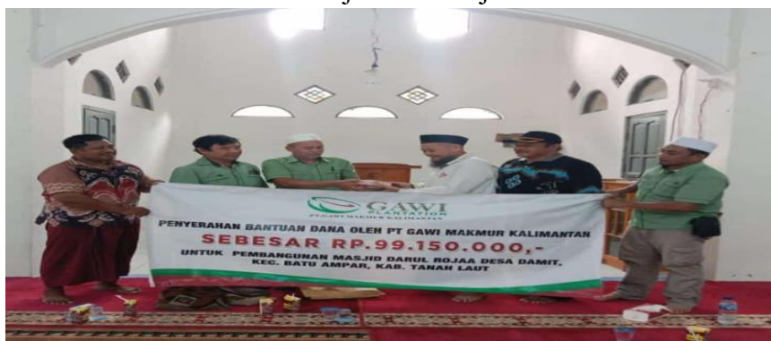
Gambar 4.16 CSR untuk Masjid darul Rojaa

Pembangunan masjid Darul Rojaa mengalami sedikit kendala dalam hal biaya oleh karenanya pembangunan terpaksa dihentikan untuk sementara. Sebagai wujud Corporate Social Responsibility PT. Gawi Makmur kepada masyarakat Desa Damit perusahaan memberikan dana CSR untuk membantu pembangunan Masjid Darul Rojaa. Bantuan yang diberikan PT. Gawi Makmur adalah sebesar RP 99.150.000.