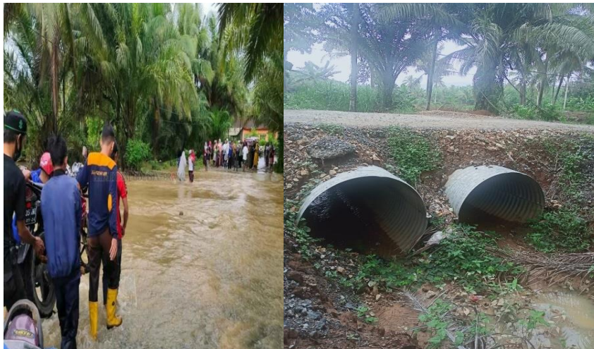
Gambar 4.17 Gorong-gorong Baja Desa Damit Hulu

berupa pembangunan gorong-gorong baja, pembangunan ini dilaksanakan dengan total biaya Rp 120.000.000