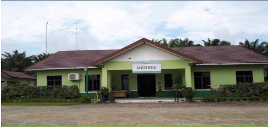
Gambar 4.1 Kantor PT. Gawi Makmur