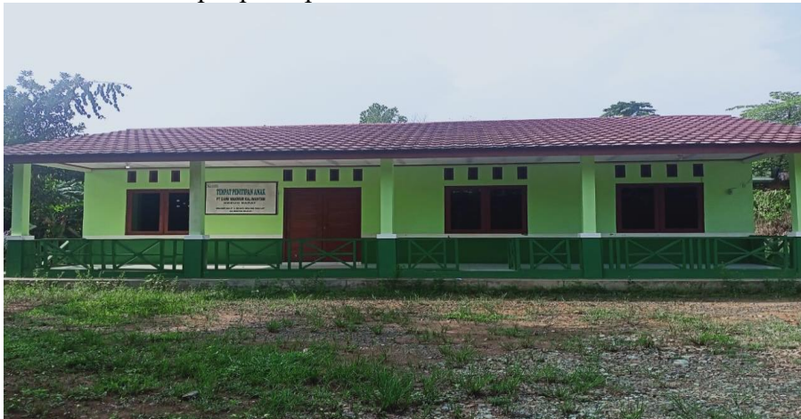
Gambar 4.9 Tempat penitipan anak