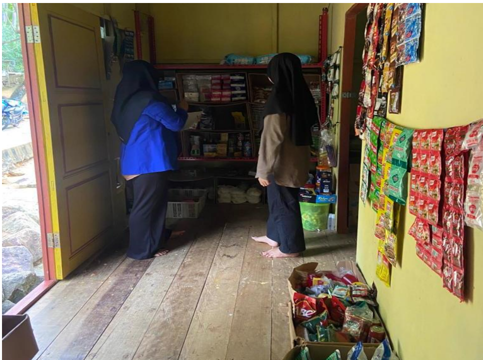
Observasi ke Toko Sembako BUMDes Karya Pulau