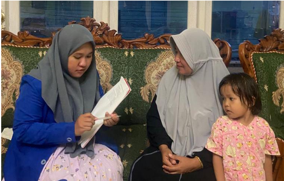
Wawancara bersama Ibu Muli Selaku Masyarakat Desa Pulau Kerumputan