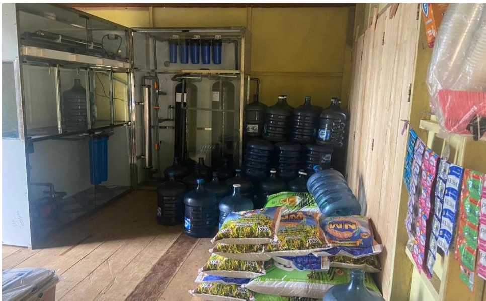
Observasi ke Toko Sembako BUMDes Karya Pulau