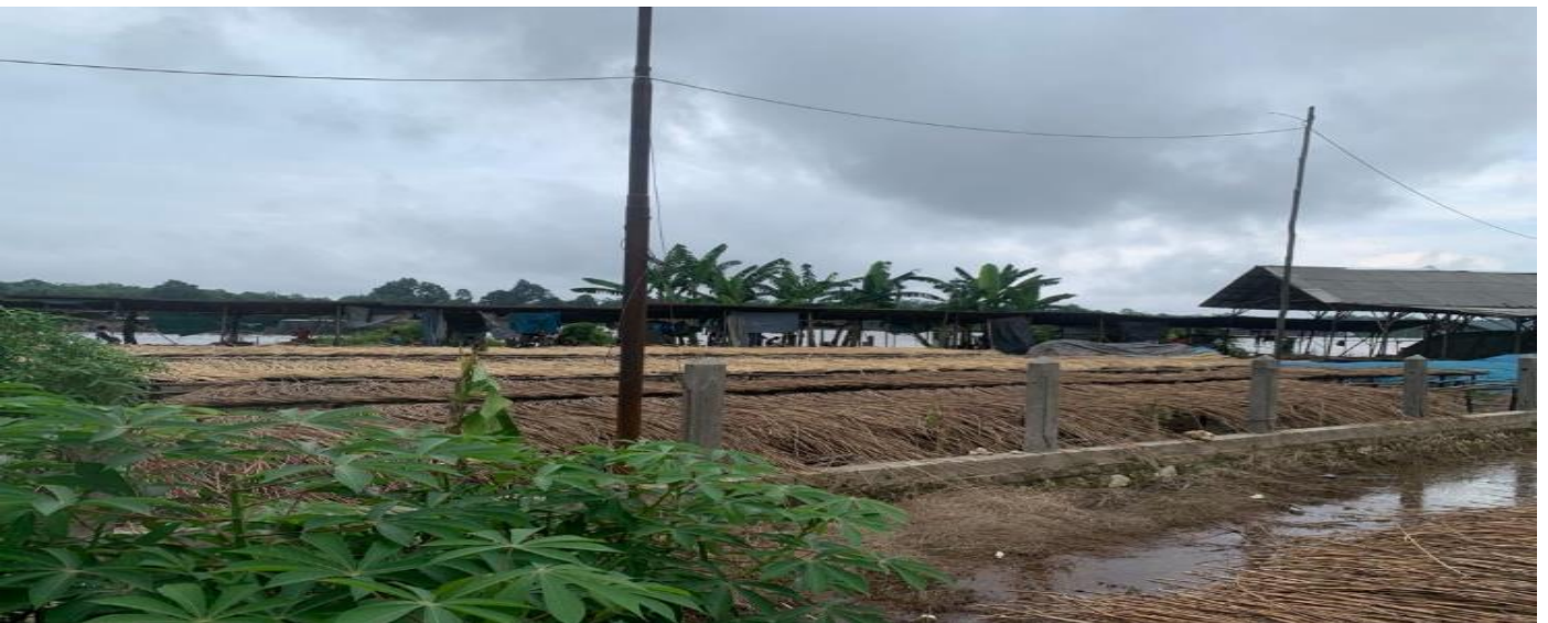
Gambar 12. Tempat usaha rotan di Kelurahan Jelapat, Kecamatan Dusun Selatan.