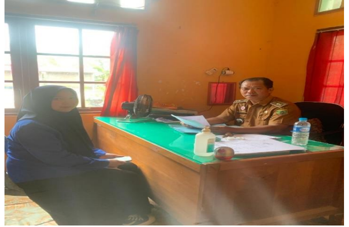
Gambar 9. Wawancara dengan Bapak Lurah, pada 20 Desember 2023. Di Kantor Kelurahan Jelapat, Kecamatan Dusun Selatan.