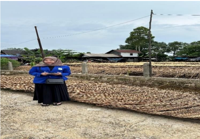
Gambar 10. ketika berada ditempat usaha rotan di Kelurahan Jelapat, Kecamatan Dusun Selatan.