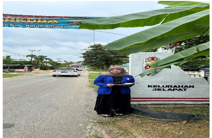
Gambar 11. Berada di gerbang di Kelurahan Jelapat, Kecamatan Dusun Selatan.