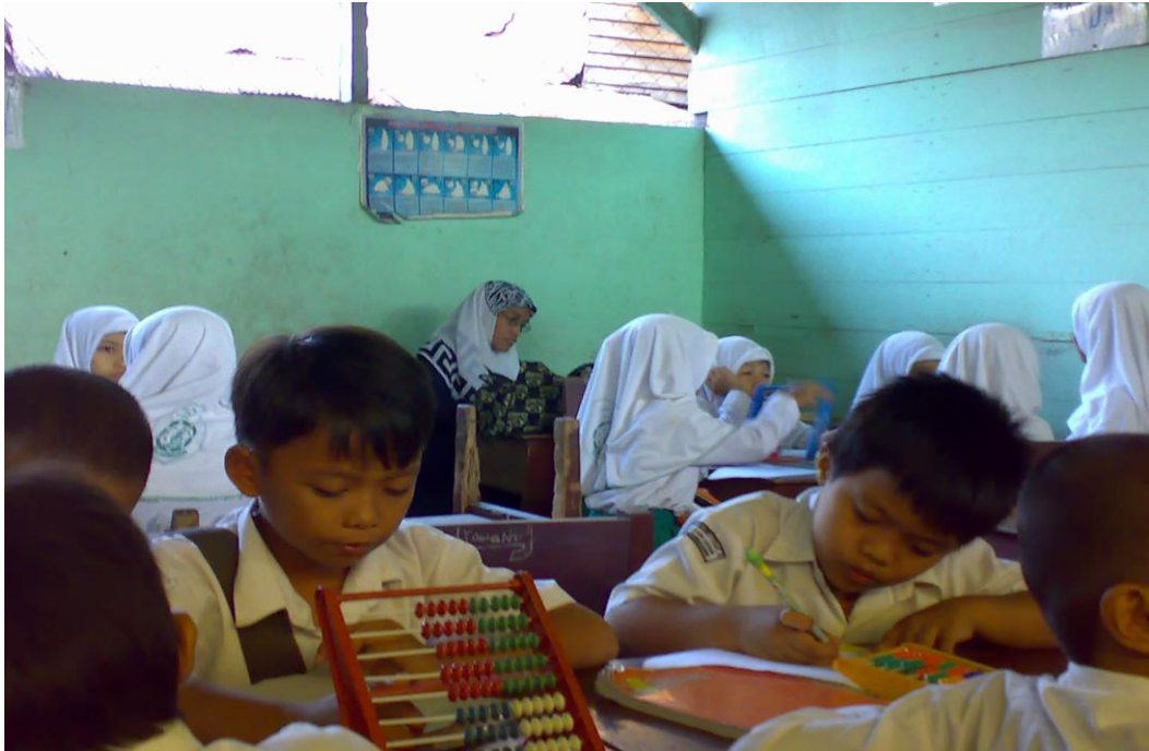
Siswa (i) sedang mengerjakan LKS secara berkelompok berdasarkan kelompok Tim Ahli sebelum mereka ke kelompok asal.