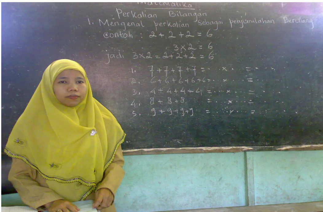
Peneliti sedang memberikan penjelasan tentang materi “Perkalian Bilangan Sebagai Penjumlahan Berulang.”