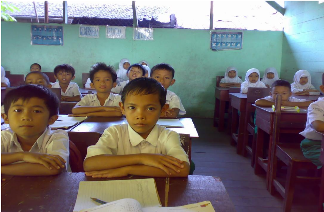
Siswa (i) sedang mendengarkan penjelasan dari peneliti tentang materi “Perkalian Bilangan Sebagai Penjumlahan Berulang.”