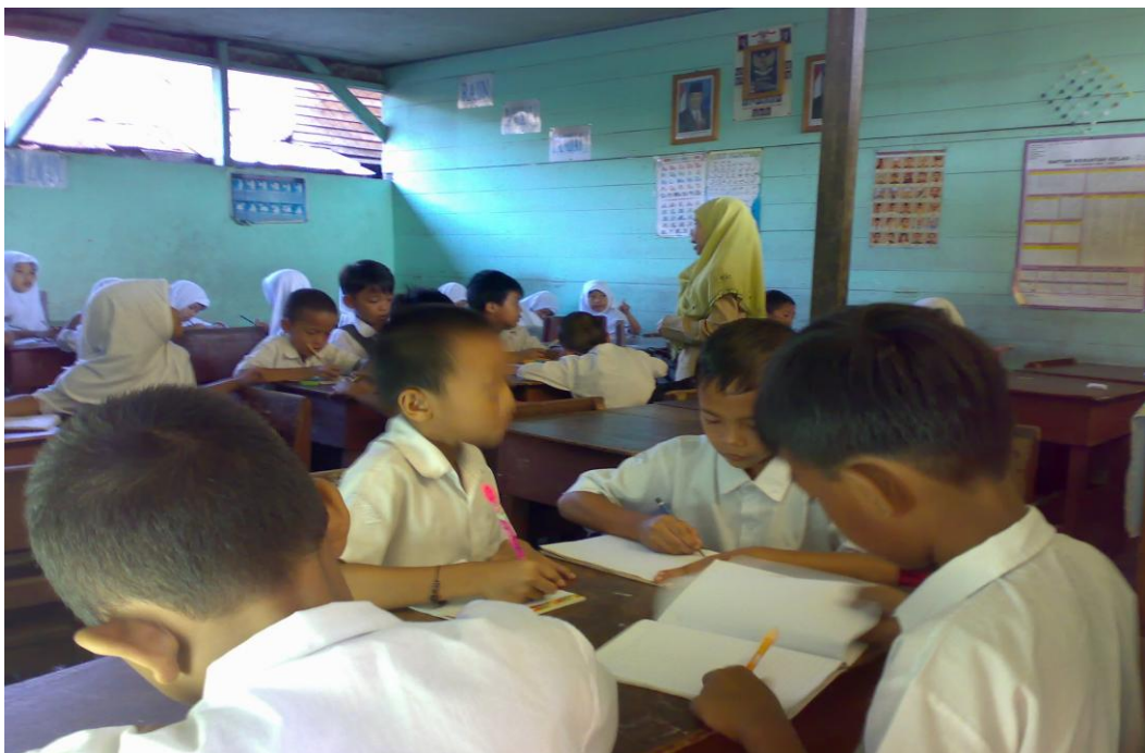
Peneliti sedang memberikan pengarahan cara kerja kelompok sebelum mereka membentuk kelompok Tim Ahli.