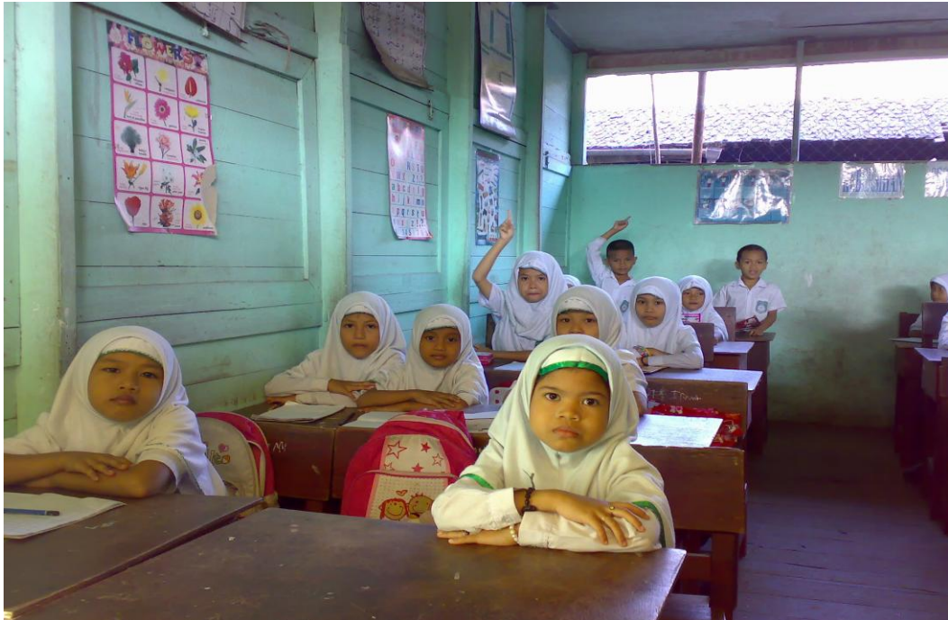
Proses tanya jawab ketika peneliti melakukan apersepsi pada saat proses belajar-mengajar.