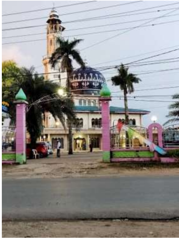
Gambar Masjid At-Taqwa Binuang Kecamatan Binuang Kabupaten Tapin