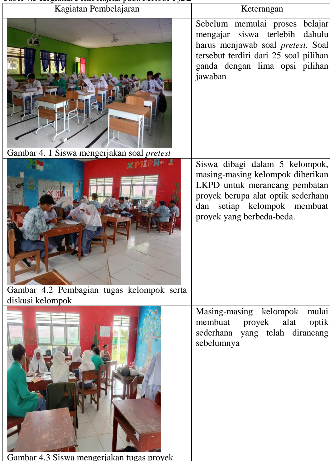
Tabel 4.3 Kegiatan Pembelajaran pada Metode PjBL

alat optik. Kegiatan pembelajaran pada penelitian ini dapat dilihat pada tabel 4.3 berikut.