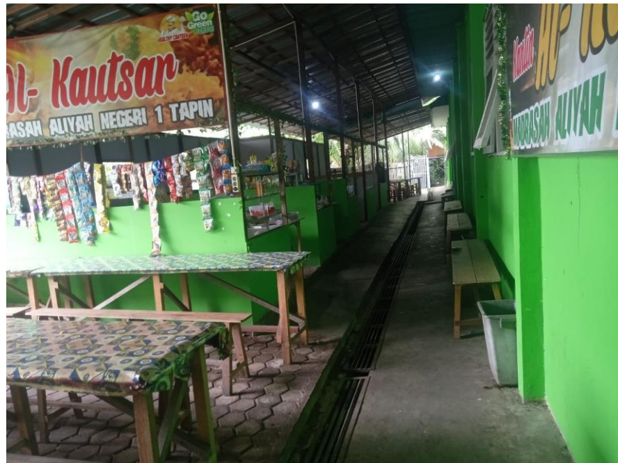
2.5 Kantin MAN 1 Tapin