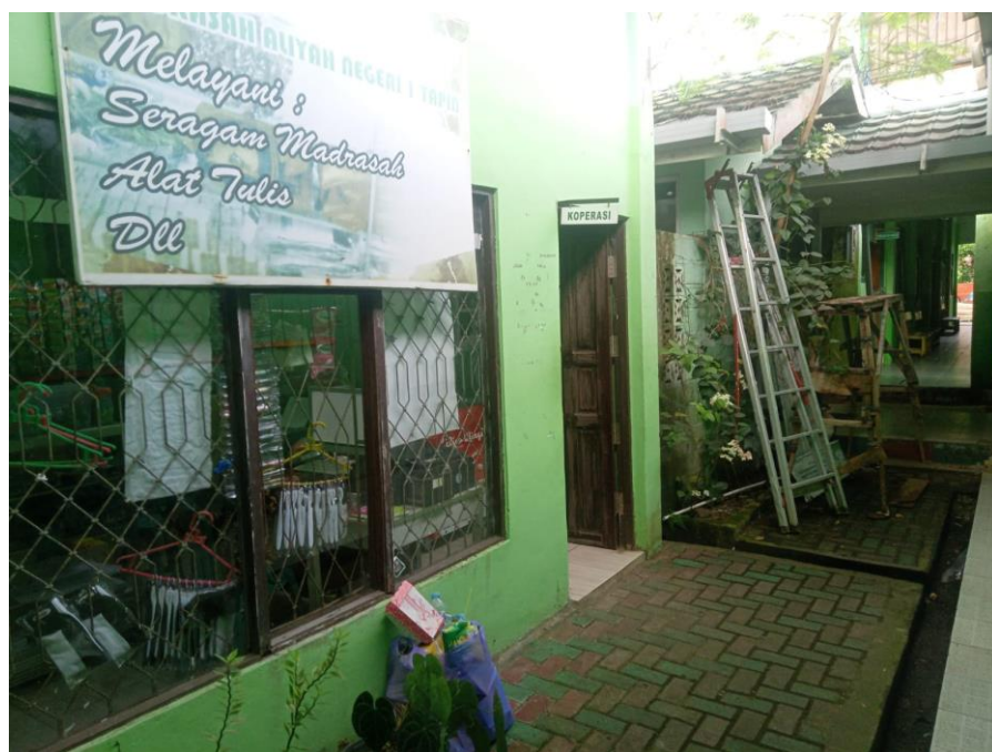
2.8 Koperasi MAN 1 Tapin