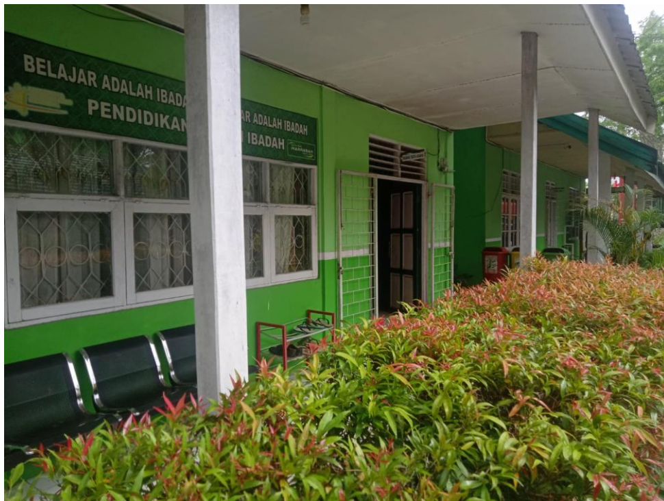
2.9 ruang TU MAN 1 Tapin