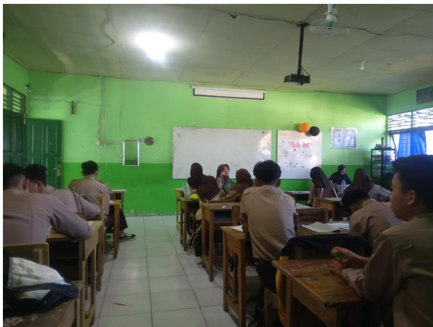
2.7 Kelas X MAN 1 Tapin