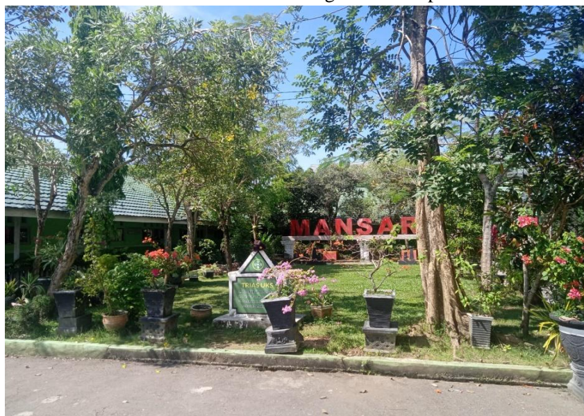
2.2 Taman MAN 1 Tapin