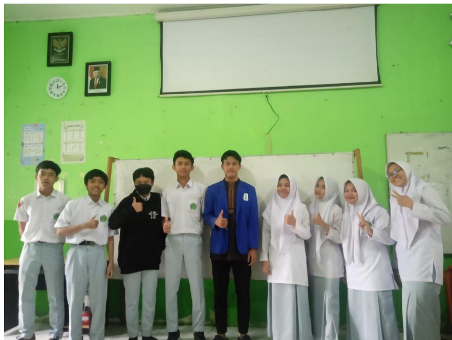
2.4 Peserta Didik dan Siswi MAN 1 Tapi