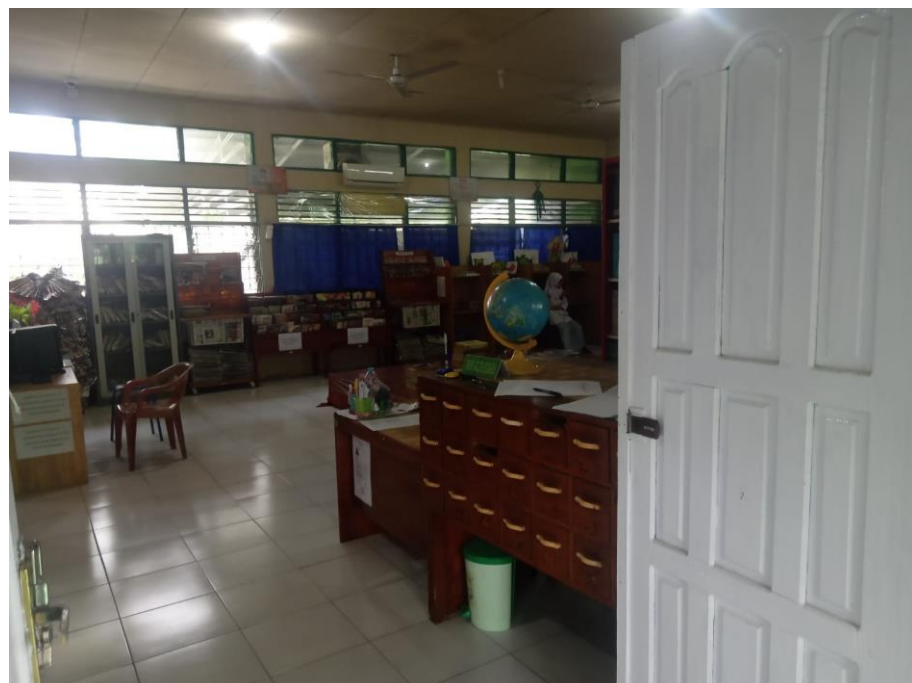
2.6 Perpustakaan MAN 1 Tapin