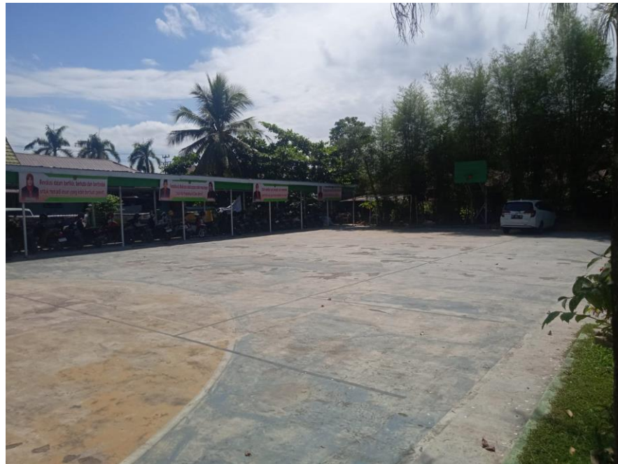
2.3 Lapangan Olahraga MAN 1 Tapin