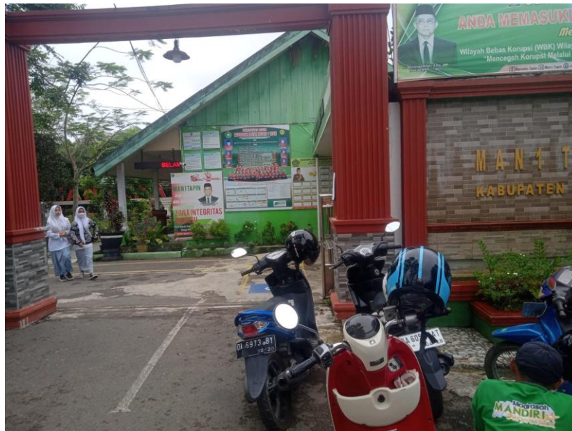
2.1 Gerbang MAN 1 Tapin