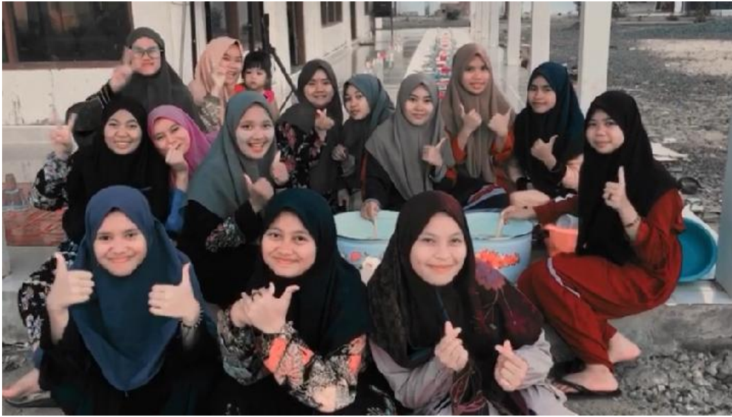
Kegiatan Dhaurah Ramadhan 2023