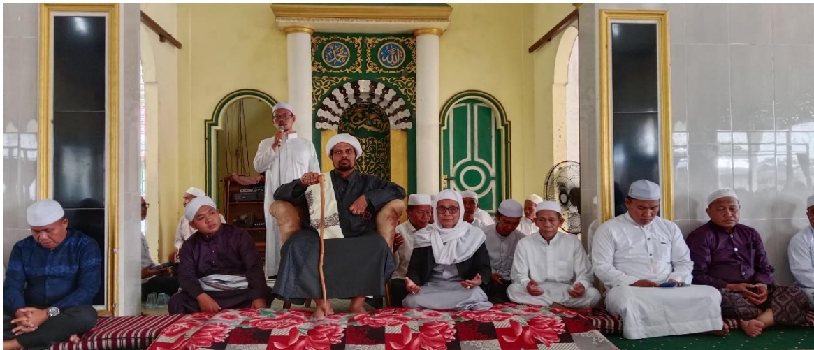
Kegiatan Majelis Bulanan Pondok Pesantren Putri At-Thohiriyah