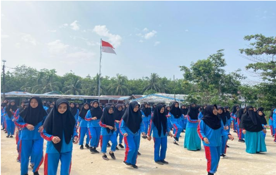
Ekstra Kurikuler Santriwati Pondok Pesantren Putri At-Thohiriyah