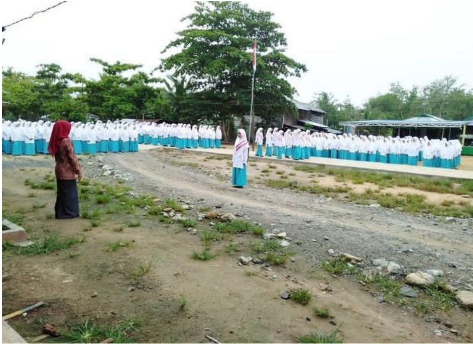
Foto apel pagi santriwati