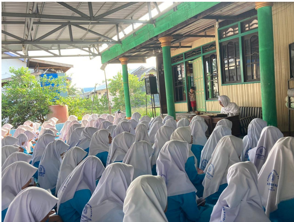
Kegiatan Khalaqah Pagi dan belajaran malam bersama