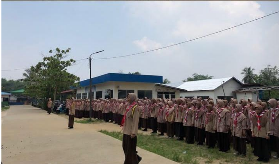
Apel Pramuka Pondok Pesantren Putri At-Thohiriyah