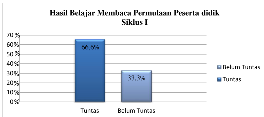
Gambar 4.2 Grafik Hasil Belajar Membaca Permulaan Peserta Didik Siklus I

Hasil tersebut menunjukkan bahwa nilai tertinggi yang diperoleh peserta didik adalah 88, nilai terendah 43, nilai rata-rata 69, jumlah peserta didik yang tuntas sebanyak 16 peserta didik atau 66,6%, dan masih terdapat 8 peserta didik yang belum tuntas membaca diantaranya terdapat 2 peserta didik yang masih kesulitan membaca dan bahkan kesulitan mengenal huruf, sementara 6 peserta didik lainnya masih belum bisa membaca dengan baik dan lancar.