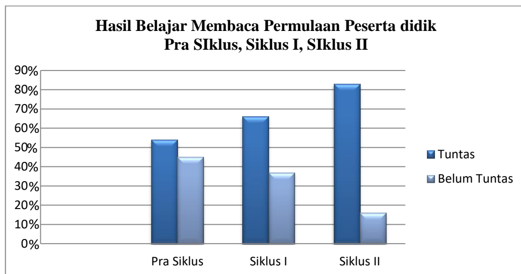
Gambar 4.4 Grafik Hasil Belajar Membaca Permulaan Peserta Didik Pra Siklus, Siklus I, Siklus II

Dari tabel dan grafik di atas terlihat adanya perbedaan serta peningkatan hasil belajar dari pra siklus, siklus I, dan siklus II. Sebelum melakukan tindakan atau pra siklus dari jumlah 24 peserta didik hanya 13 yang mencapai KKM 70 dengan persentase 54,1% atau 11 peserta didik yang belum tuntas memperoleh persentase 45,8%. Setelah dilakukan siklus I terdapat 16 peserta didik tuntas dengan persentase 66,6% atau 8 peserta didik yang belum tuntas memperoleh persentase 33,3%. Kemudian peneliti melanjutkan pada siklus II dengan memperoleh 20 peserta didik yang tuntas dari jumlah peserta didik 24 atau 83,3% dan 4 peserta didik yang belum tuntas atau 16,6%.