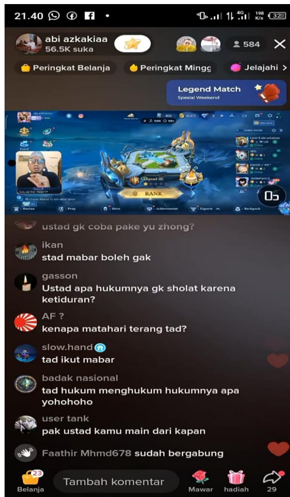
Gambar 4.7 Live Streaming Tik Tok Ustadz Abi Azkacia