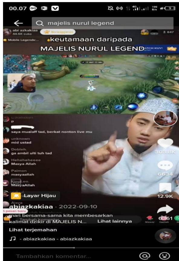
Gambar 4.2 Keutamaan Majelis Nurul Legend