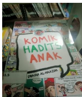
Gambar 4.2. Buku komik hadist anak (salah satu buku koleksi fiksi)