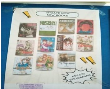
Gambar 4.1. Daftar dan foto cover buku koleksi fiksi di mading kelas

Selain dari hasil wawancara, berdasarkan hasil observasi yang dilakukan penulis bahwa terdapat daftar dan foto cover buku yang tertempel di mading salah satu kelas di SMP Islam Sabilal Muhtadin, selain itu terdapat beberapa buku koleksi fiksi yang tertata rapi di rak buku perpustakaan SMP Islam Sabilal Muhtadin Banjarmasin. Berikut hasil observasi daftar dan foto cover dan buku koleksi fiksi dapat di lihat digambar 4.1, 4.2 dan 4.3.