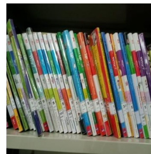
Gambar 4.3. Beberapa penampilan buku koleksi fiksi di rak perpustakaan SMP Islam Sabilal Muhtadin Banjarmasin

Berdasarkan hasil wawancara dan observasi yang telah dikumpulkan sebelumnya, dapat disimpulkan bahwa pengelola perpustakaan menggunakan