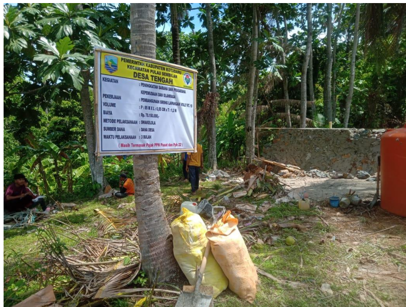
Pembangunan Siring Lapangan Volly di Desa Tengah