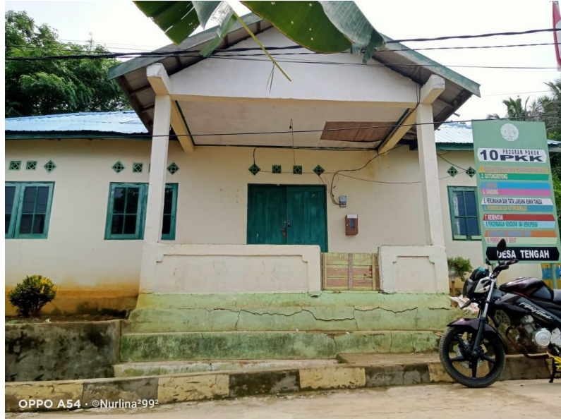
Kantor Desa Tengah Kecamatan Pulau Sembilan