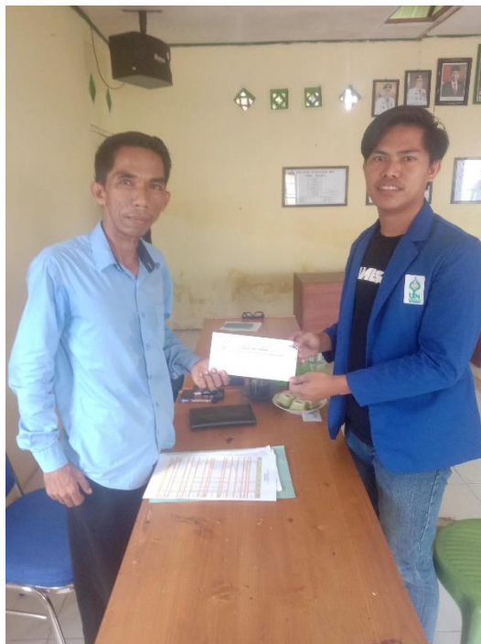
Pengambilan Surat Selesai Riset