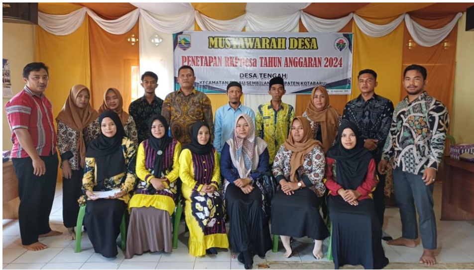
Musyawahar Desa Penetapan RKPDesa Tahun Anggaran 2024 Desa Tengah