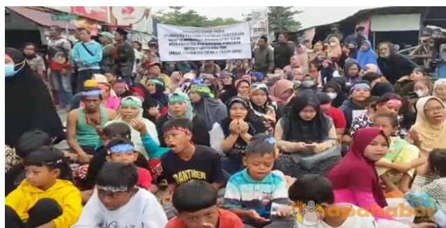
Gambar 4. 3 Warga menutup akses jalan masuk Pasar Batuah

Pada saat hari mau menertibkan Pasar Batuah juga terdapat kendala yang dihadapi oleh Satpol PP Kota Banjarmasin. Seperti yang dijelaskan oleh Bapak Mulyadi bahwa ketika ingin menertibkan Pasar Batuah seperti adanya gugatan yang dilayangkan oleh warga Pasar Batuah, karena warga tidak mau dipindahkan atau direlokasi sementara. Kemudian warga Pasar Batuah juga mengarahkan massa untuk menghalangi petugas agar tidak melakukan penertiban.