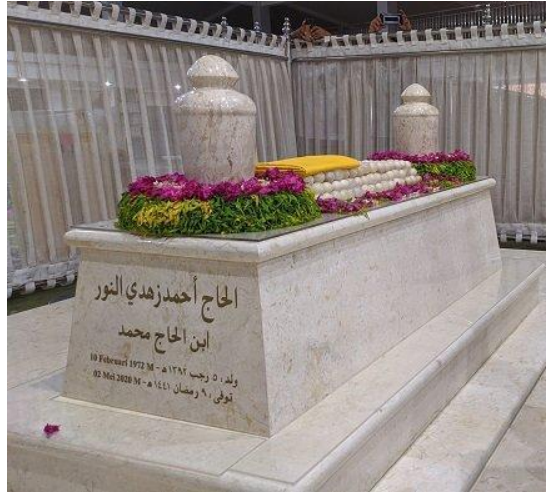
Gambar 3.5: Makam Guru Zuhdi