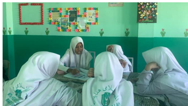
Gambar 4.2 Siswa berdiskusi kelompok

Diskusi berjalan lancar dan terarah walaupun masih banyak siswa yang bertanya terkait yang mereka belum mengerti. Pada saat diskusi berlangsung, guru berkeliling untuk melihat sejauh mana yang mereka bisa selesaikan. Dalam setiap kelompok terdapat satu atau dua orang yang pemahamannya lebih daripada anggota kelompok yang lain, berkat adanya mereka maka menjadikan anggota yang lain bisa bertanya kepada mereka apabila masih belum mengerti dan memahami.