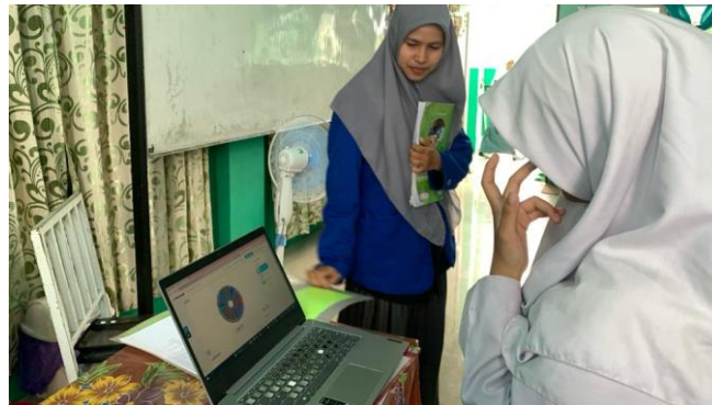
Gambar 4.6 Guru mengadakan permainan

Setelah permainan berakhir, guru menyampaikan materi yang akan dipelajari dan tujuan pembelajaran kepada siswa. Guru memberikan motivasi kepada siswa agar bersungguh-sungguh dalam belajar dan menjelaskan manfaat SPLDV dalam kehidupan sehari-hari. Siswa mendengarkan dan memperhatikan apa yang disampaikan guru.