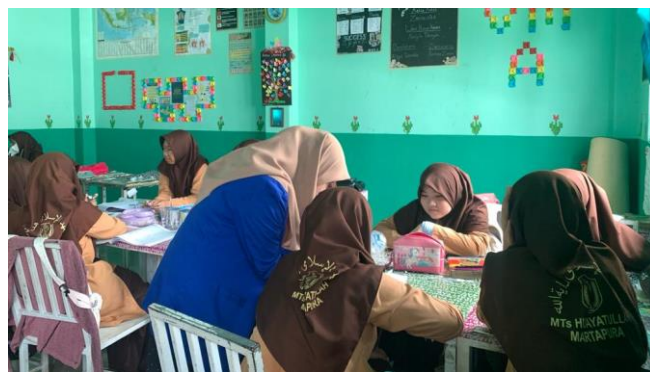
Gambar 4.4 Guru mengawasi dan membimbing diskusi kelompok