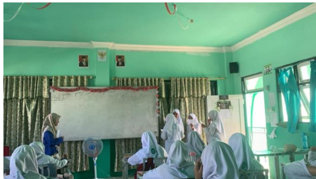
Gambar 4.1 Siswa melakukan drama singkat

Kegiatan inti merupakan proses interaksi antara guru dengan siswa dalam proses kegiatan belajar mengajar yang memiliki tujuan untuk mencapai tujuan pembelajaran. Setelah guru melakukan kegiatan pembukaan yang dapat membuat siswa senang, selanjutnya adalah memberikan kesempatan siswa untuk ikut memikirkan permasalahan yang sudah disajikan.