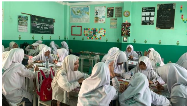
Gambar 4.7 Kelompok mendiskusikan dan mengkritisi permasalahan

Guru membagikan LKPD 3 kepada setiap kelompok. Guru meminta setiap kelompok untuk mendiskusikan dan mengkritisi permasalahan yang diberikan di LKPD 1 serta menentukan alternatif-alternatif pemecahan masalah sesuai indikator berikir kritis dan pemecahan masalah. Setiap kelompok menentukan pemecahan masalah yang paling sesuai dan menuliskan hasilnya pada LKPD yang telah disediakan. Kemudian guru mengawasi dan membimbing diskusi keseluruhan kelompok.