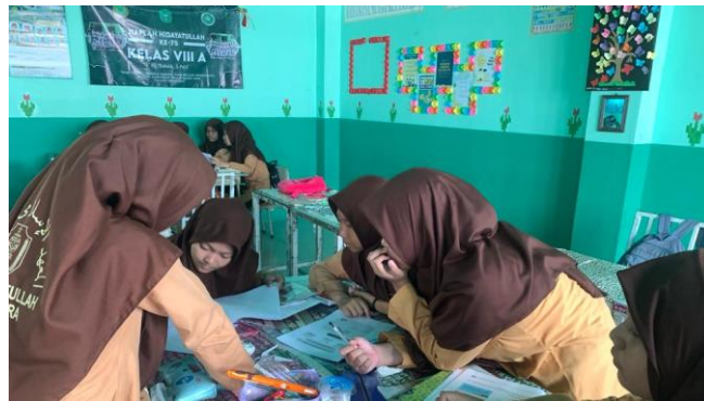
Gambar 4.3 Siswa berdiskusi kelompok