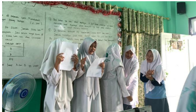
Gambar 4.8 Kelompok mengungkapkan gagasannya di depan kelas

sebuah permasalahan yang berbeda sebagai produk kreatif hasil kreativitas mereka serta menyelesaikan permasalahan yang telah mereka buat sendiri.