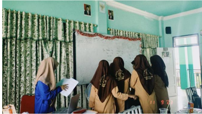
Gambar 4.5 Kelompok mengungkapkan gagasannya di depan kelas

berbeda dan sekreatif mungkin sebagai produk kreatif hasil kreativitas mereka serta menyelesaikan permasalahan yang telah mereka buat sendiri.