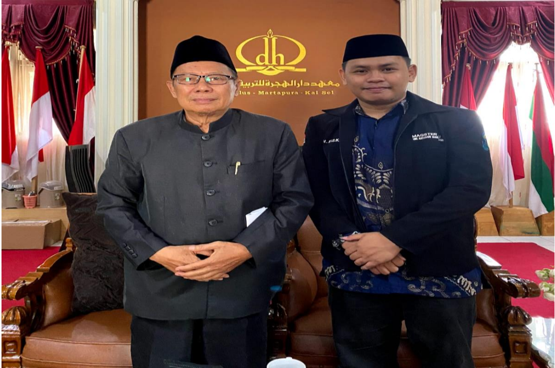
Wawancara dan Dokumentasi bersama Pimpinan Pondok Pesantren Darul Hijrah