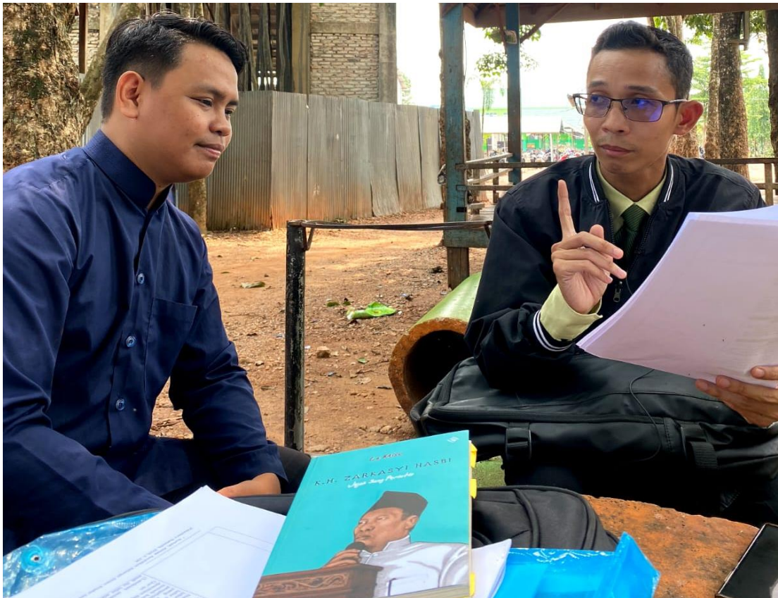
Wawancara dan Dokumentasi bersama anak Pimpinan Pondok Pesantren Darul Hijrah Cindai Alus