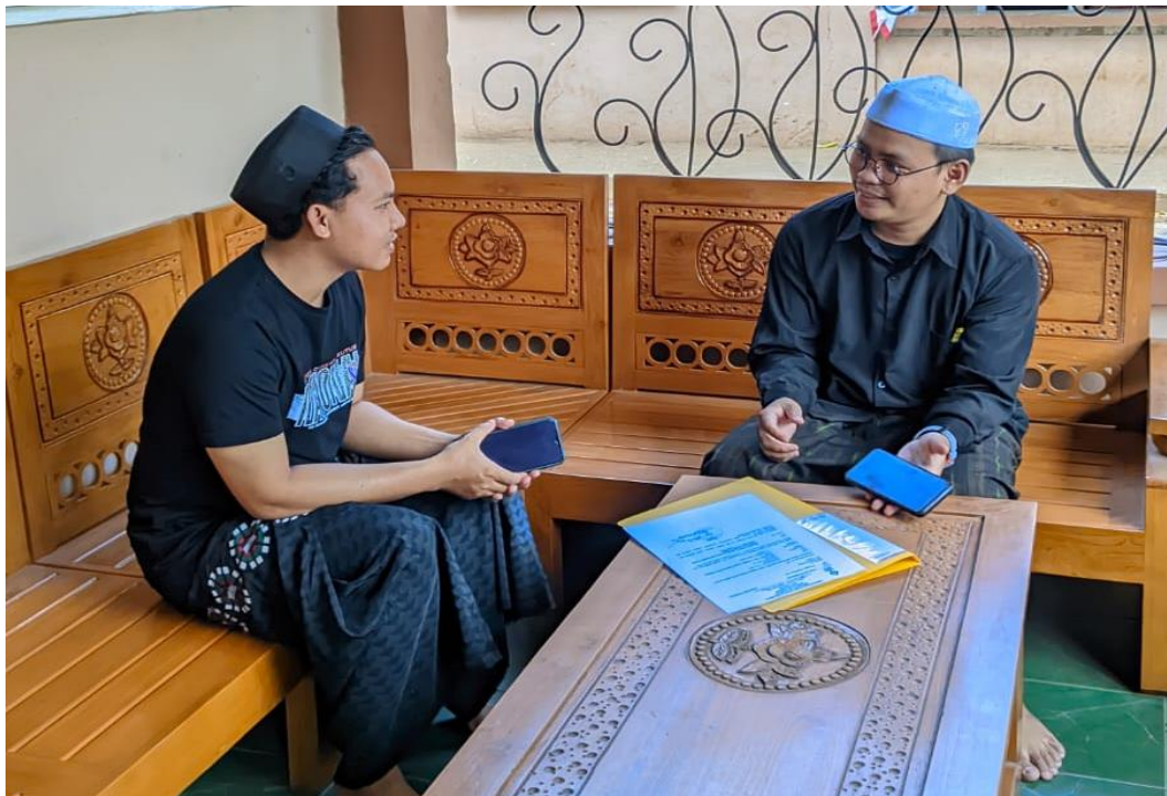
Observasi dan menyerahkan surat riset penelitian kepada petugas Skretariat Pondok Pesantren Darul Hijrah