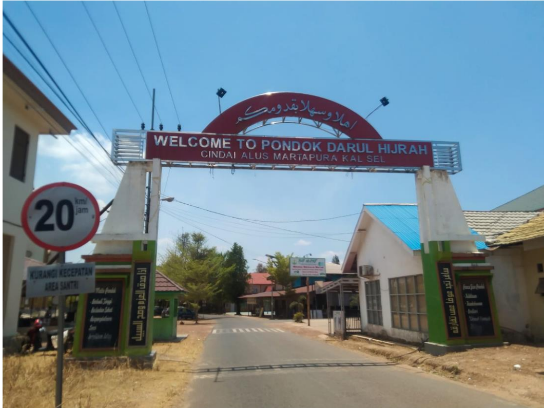
Observasi ke Pondok Pesantren Darul Hijrah Cindai Alus Martapura