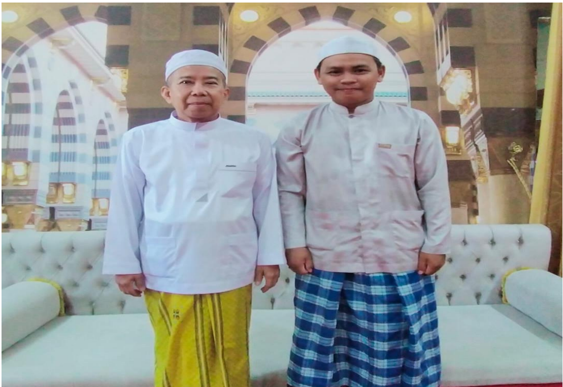
Wawancara dan Dokumentasi bersama Pimpinan Pondok Pesantren Darussalam