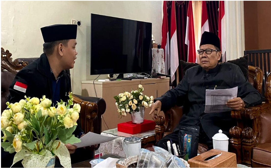
Wawancara dan Dokumentasi bersama Pimpinan Pondok Pesantren Darul Hijrah