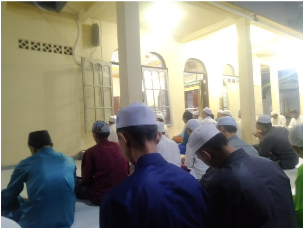
Observasi ke Majelis Mingguan di Mushola Mushola Raudhotus Sholihin setiap malam sabtu, Jl. Pintu Air Gg. Raudah