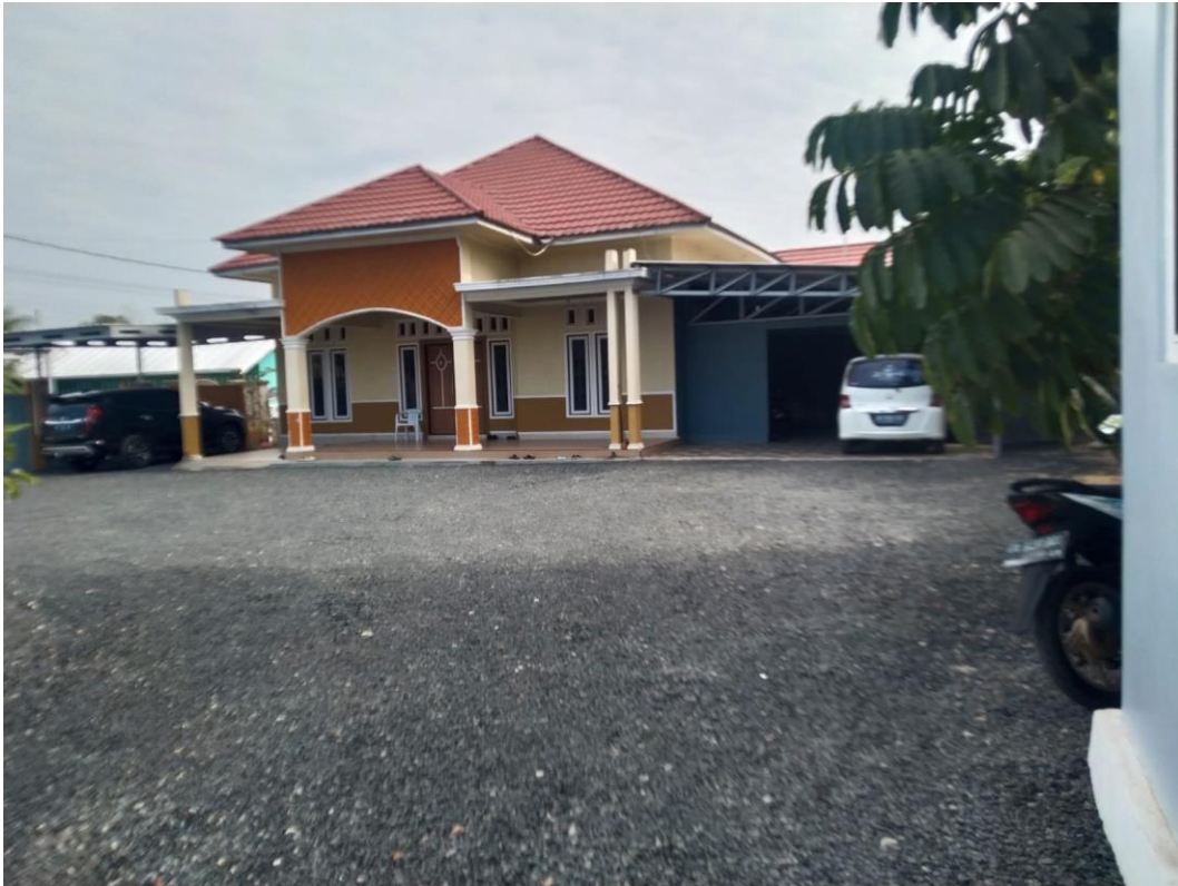
Observasi ke tempat tinggal Pimpinan Pondok Pesantren Darussalam Martapura