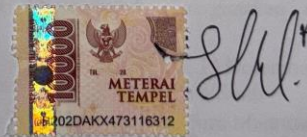
Noor Auliya Huda

Banjarmasin, 13 Desember 2023 Yang membuat pernyataan,