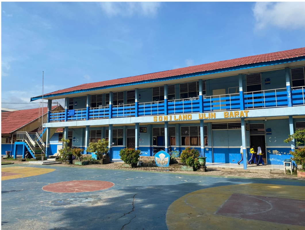
Gambar 4.1 SDN 1 Landasan Ulin Barat

SDN 1 Landasan Ulin Barat beralamatkan di Jalan A. Yani Km. 21 Kelurahan Landasan Ulin Barat Kecamatan Liang Anggang Kota Banjarbaru Kalimantan Selatan. Adapun visi dan misi SDN 1 Landasan Ulin Barat yaitu sebagai berikut: