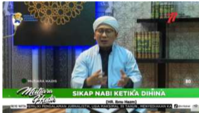
Gambar 4. 5 Cuplikan Tayangan Mutiara Hadits

jam 18.00-18.30 wita dan akan di Playback pada sore harinya, acara ini tayang pada hari yaitu Sabtu dan Minggu dan di produksi melalui Tapping .