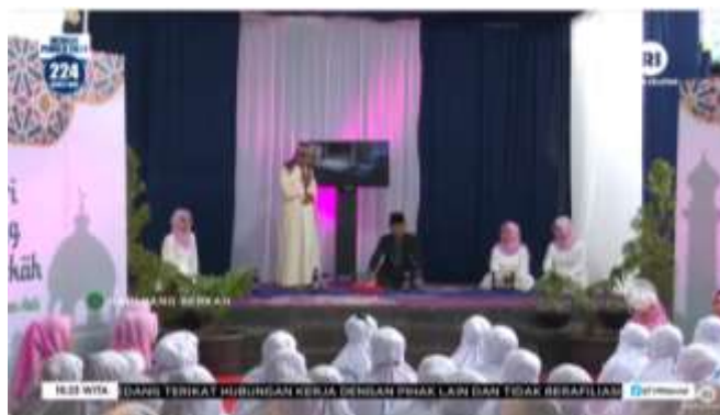
Gambar 4. 9 Cuplikan Tayangan Hari Yang Berkah

Hari Yang Berkah merupakan acara yang menghadirkan audiens dan merupakan acara yang menghadirkan beragam narasumber dan audiens sesuai dengan Topik yang dibicarakan. Acara ini diproduksi melalui Tapping dan disiarkan melalui Stasiun TVRI Kalimantan Selatan serta diunggah melalui youtube adapun penayangan Hari Yang Berkah pada hari Minggu jam 16.00-17.00 Wita. Acara ini memiliki Slogan yaitu “Hari Yang Berkah, Sejukkan Hati”