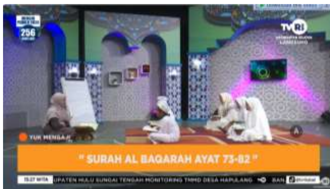
Gambar 4. 8 Cuplikan Tayangan Yu'Mengaji

Yu'Mengaji merupakan acara yang ditargetkan untuk anak-anak, acara ini tayang di setiap hari jumat pada Jam 15.00-16.00 wita secara live melalui stasiun TVRI Kalimantan Selatan Dan youtube. Menyuguhkan episode tentang edukasi membaca Al-Quran seperti hukum bacaan Al-Quran yang lebih kita kenal dengan tajwid, acara ini juga meghadirkan audiens dari sekolah–sekolah yang ada di Kalimantan Selatan.