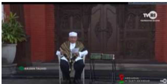
Gambar 4. 3 Cuplikan Tayangan Kajian Tauhid

Program Kajian Tauhid tayang disetiap hari senin sampai rabu, pada pukul 05.30-06.00 wita, dengan jumlah durasi 30 menit yang di produksi melalui Tapping .