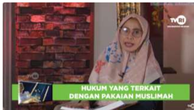
Gambar 4. 4 Cuplikan Tayangan Fikih Wanita

Program acara yang berjudul Fikih Wanita ditayangkan pada hari Kamis sampai Jumat, dengan jam tayang yang sama dengan program kajian tauhid yaitu pukul 05.30-06.00 wita. program yang berdurasi 30 menit ini juga akan di Playback pada sore hari menjelang magrib jam 18.00-18.30 dengan tema-tema yang sama sebagaimana di siarkan pada pagi hari sebelumnya. Acara Fikih Wanita merupakan produksi melalui tapping , bukan melalui siaran langsung.