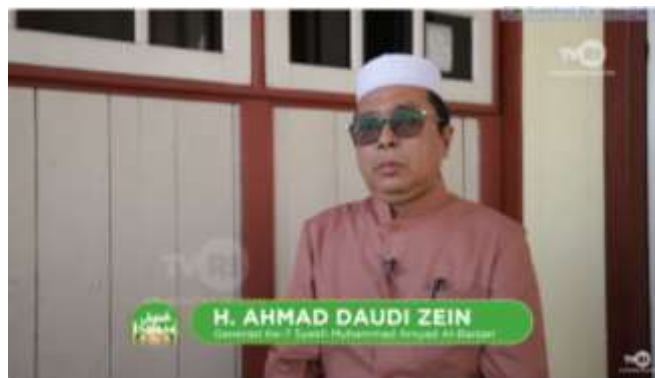
Gambar 4. 6 Cuplikan Tayangan Jejak Islam

Program Jejak Islam ini berupa Feature yang ditayangkan satu bulan sekali yaitu setiap tanggal 20 disetiap bulannya dan ditayangkan melalui TVRI Nasional pada jam 04.00 WIB dan akan di Playback pada jam 18.30 WITA pada siaran TVRI Lokal Kalimantan Selatan.