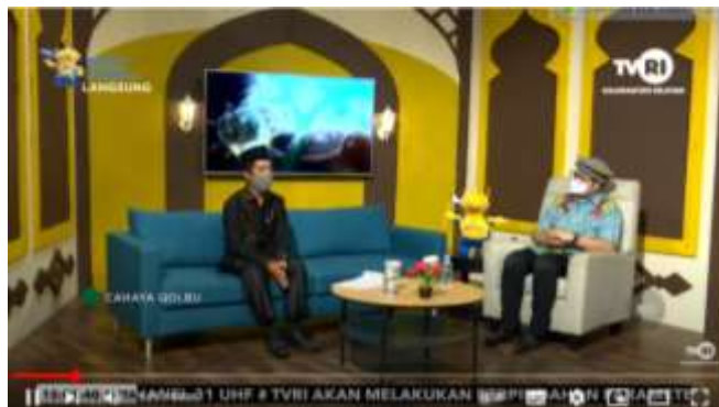
Gambar 4. 7 Cuplikan Tayangan Cahaya Qolbu

Cahaya Qolbu tayang setiap hari Kamis Jam 15.00-16.00 Wita dan ditayangkan secara live melalui televisi dan youtube dengan menghadirkan beragam narasumber dengan topik yang berbeda-beda.