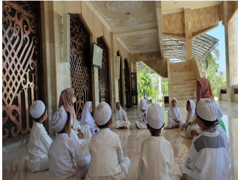
Gambar 4.3 Kegiatan Anak Muroja'ah Hafalan Melalui Kegiatan Outdoor