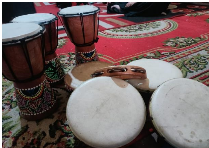
Gambar 4. 3 Alat Musik Rebana di RA Datu Abulung (CLDF.7)

Gambar 4.2 (DLDF.6) di atas merupakan ruangan kelas yang dijadikan ruangan pembelajaran seni Rebana. Guru biasanya hanya perlu mempersiapkan ruangan dengan merapikan meja belajar anak-anak. Terkadang guru juga bisa meminta anak-anak untuk merapikan meja belajar secara mandiri.