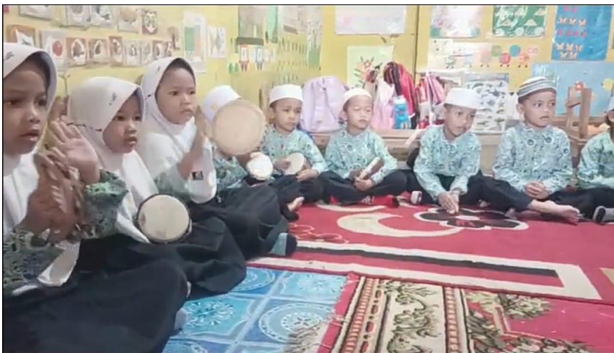
Gambar 4. 8 Anak-anak Memainkan Alat Musik Rebana II (CLDF.13)

Gambar 4.7 (CLDF.12) dan 4.8 (CLDF.13) di atas merupakan kegiatan anak-anak menggunakan atau memainkan alat musik Rebana. Tidak hanya menggunakan, anak-anak juga melantunkan syair dan shalawat. Anak-anak menggunakan alat musik Rebana setelah mendengarkan penjelasan dan pengajaran