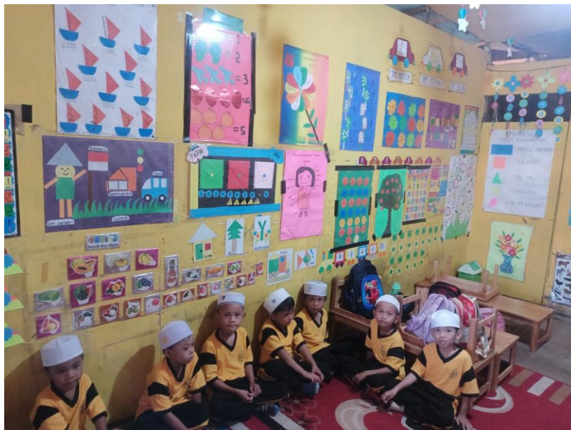
Gambar 4. 4 Kegiatan Pengenalan Rebana I (CLDF.9)

Pelaksanaan pembelajaran seni Rebana di Ra Datu Abulung dilakukan dengan guru pertama kali menjelaskan mengenai alat musik rebana dan juga shalawat sebelum anak-anak menggunakan alat musik tersebut. Hal ini dapat dilihat pada dokumentasi kode CLDF.9 dan CLDF.10.