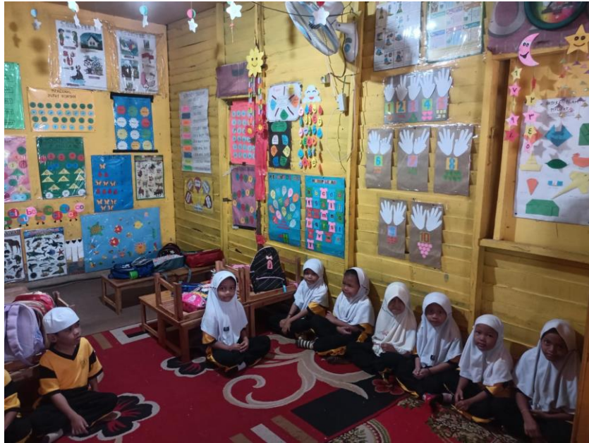
Gambar 4. 5 Kegiatan Pengenalan Rebana II (CLDF.10)

Gambar 4.4 (CLDF.9) dan 4.5 (CLDF.10) di atas merupakan instruksi atau penjelasan dari guru kepada anak-anak untuk mengenal jenis Rebana yang akan dibawakan. Anak-anak terlihat mendengarkan penjelasan dari guru dengan cermat dan pengenalan ini tidak dilakukan lama oleh guru demi mencegah rasa bosan dari anak. Guru kemudian menjelaskan penggunaan alat musik Rebana dengan tiga jenis alat musik. Setelah melaksanakan kegiatan seni rebana penulis menanyakan perasaan anak “Apakah anak-anak suka memainkan alat musik rebana ini”.