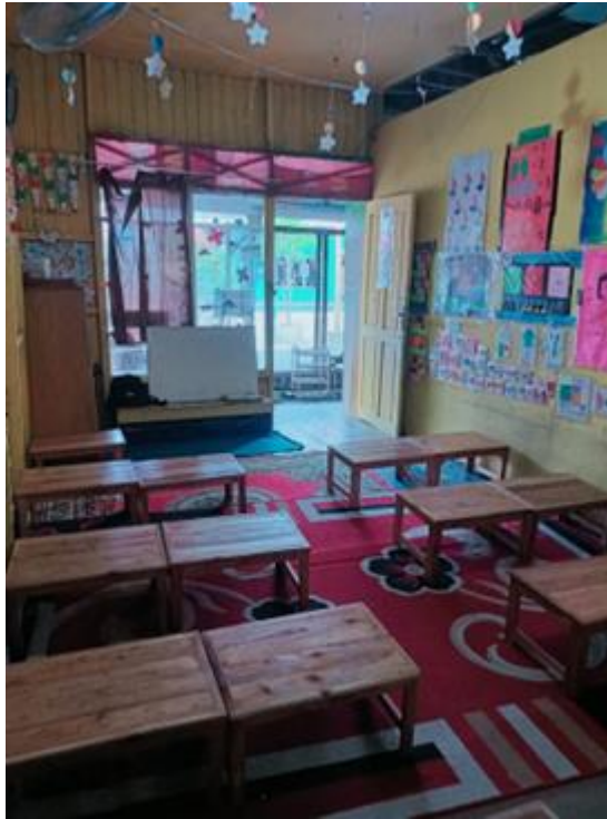
Gambar 4. 2 Ruangn Kelas Pengenalan dan Pembelajaran Rebana

Gambar 4.2 (DLDF.6) di atas merupakan ruangan kelas yang dijadikan ruangan pembelajaran seni Rebana. Guru biasanya hanya perlu mempersiapkan ruangan dengan merapikan meja belajar anak-anak. Terkadang guru juga bisa meminta anak-anak untuk merapikan meja belajar secara mandiri.