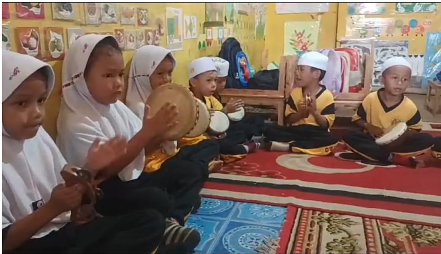
Gambar 4. 7 Anak-anak Memainkan Alat Musik Rebana I (CLDF.12)

“iya kak, kami senang bermain rebana karena bisa berkumpul dengan teman, dan kesulitannya itu awalnya dari belajar menabuh alat musiknya karena tangannya susah menyesuaikan ketukannya tapi akhirnya sudah biasa” (CLWA1)