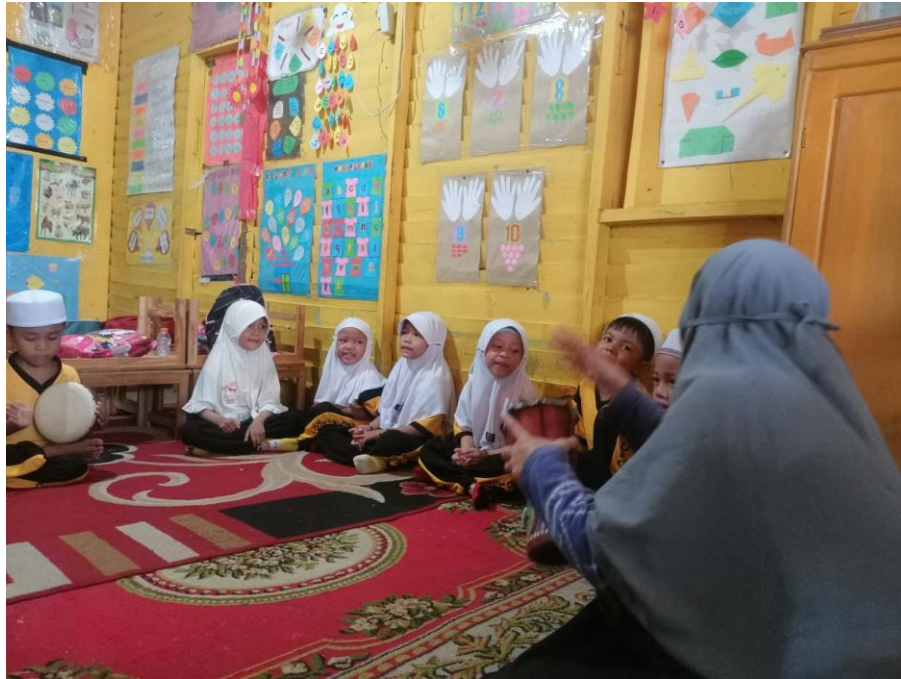
Gambar 4. 6 Kegiatan Memainkan Alat Musik Rebana (CLDF.8)

Gambar 4.6 (CLDF.8) di atas merupakan kegiatan memainkan alat musik Rebana yaitu terbang . Ada tiga alat musik yang digunakan yaitu terbang atau gendang kecil berbentuk rawis yang dimainkan anak, darbuka kecil yang dimainkan oleh guru, dan kerincing . Pada saat itu anak diajarkan cara memukul gendang secara bertahap sesuai irama yang akan dibawakan dengan lantunan shalawat. Guru pada mulanya menjelaskan nama pukulan tersebut dan mengajarkan tempo pukulan kepada anak. Kemudian anak yang memainkan gendang akan mengikuti secara perlahan. Berdasarkan hasil wawancara dengan anak, penulis menanyakan perasaan dan kesulitan saat memainkan alat musik Rebana Terbang, perasaan anak senang dan mengalami kesulitan menyesuaikan ketukan rebana terbang karena masih pada tahap awal pengenalan. Berikut kutipan wawancara untuk menguatkan argumen diatas.