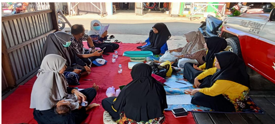
Gambar 4. 2 Tempat Kegiatan Posyandu Pos Mawar 2