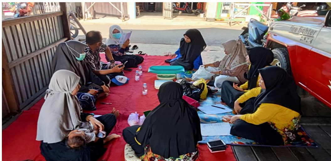
Gambar 4. 20 Kegiatan Posyandu

“Posyandu juga biasanya menghadirkan petugas kesehatan yang bekerjasama dengan kader dimana posyandu dijadikan sarana informasi bagi ibu balita untuk menambah pengetahuan dan berbagi pengalaman tentang kesehatan anak, baik dengan petugas kesehatan maupun dengan peserta posyandu lainnya. Dengan adanya posyandu balita diharap dapat menjadi lebih baik, terlebih khusus untuk memperbaiki gizi dan mencegah Stunting pada balita dan anak-anak yang ada di Desa” 63 .