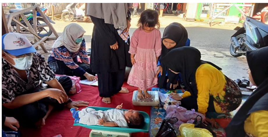
Gambar 4. 3 Kegiatan Posyandu

Penyajian data dilakukan berdasarkan hasil peneliti yang peneliti lakukan dengan menggunakan sejumlah teknik pengumpulan data seperti observasi, dokumentasi dan wawancara terhadap kader dan data tumbuh kembang balita. Hal ini dilakukan sesuai dengan fokus masalah dan tujuan yang ingin dicapai dalam menggambarkan secara mendalam tentang peran kader posyandu desa Bayanan dalam meningkatkan tumbuh kembang balita.