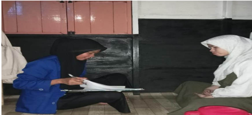
Gambar 4. 163 Wawancara dengan Ibu SA orang tua bayi di pos Mawar 2