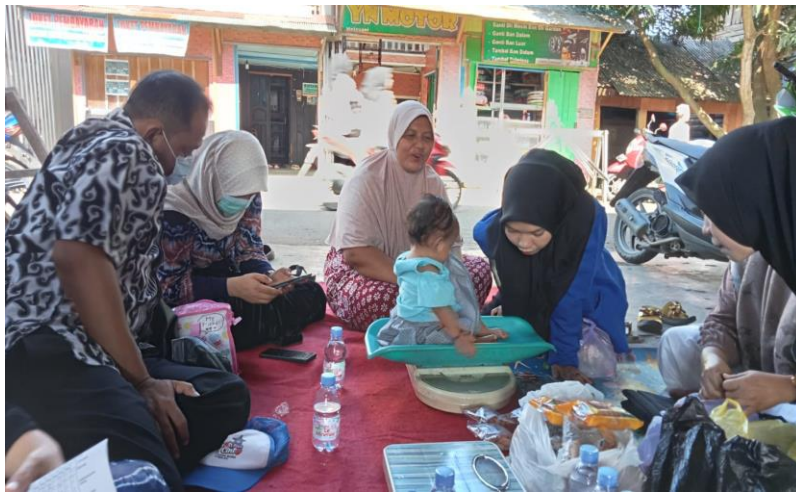
Gambar 4. 15 Kegiatan Posyandu

Pemantauan Pertumbuhan dan Perkembangan Balita, berupa pengukuran berat badan dan tinggi badan balita, Pemantauan pertumbuhan balita di Posyandu dilakukan oleh kader Posyandu dengan melakukan penimbangan berat badan dan pengukuran panjang badan/tinggi badan serta mencatatnya dalam KMS.