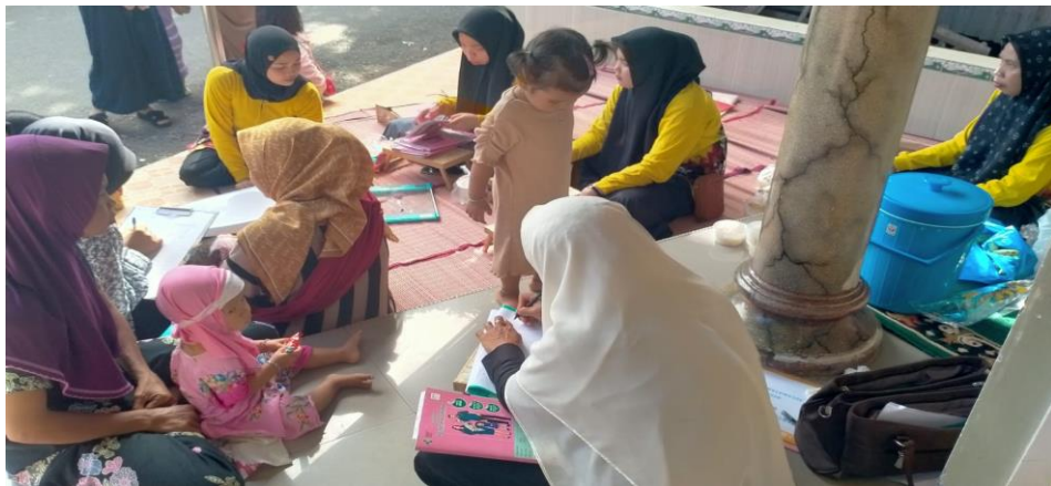
Gambar 4. 1 Tempat Kegiatan Posyandu Pos Mawar 1

Desa Bayanan sebagian besar digunakan untuk pemukiman penduduk, baik permukiman penduduk asal maupun pendatang dalam bentuk pemukiman. Sebagian besar penduduk di Desa Bayanan memiliki tempat tinggal yang terbuat dari kayu, dan papan ulin. Namun, ada juga beberapa rumah yang tergolong permanen, yang terbuat dari beton dan beratapkan genteng maupun sirap. Sebagian besar wilayah Bayanan digunakan untuk kawasan perkebunan.