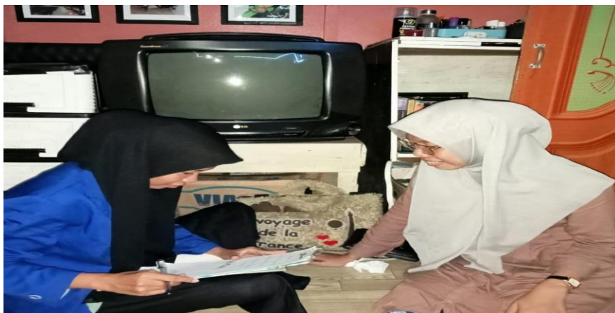
Gambar 4. 24 Wawancara dengan Ibu MN orang tua Balita di pos Mawar 2