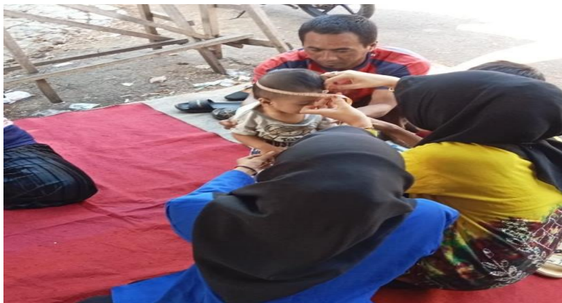
Gambar 4. 111 Kegiatan Posyandu

“Untuk Pos Mawar 2 kami rutin melaksanakan pada hari Sabtu, biasanya di infokan oleh perangkat desa lewat pemberitahuan ke rumah-rumah atau lewat pengumuman bisa juga lewat pengeras di mushalla” 56