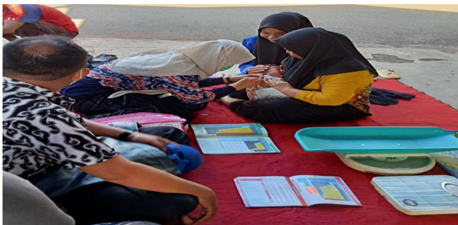
Gambar 4. 25 Kegiatan Posyandu