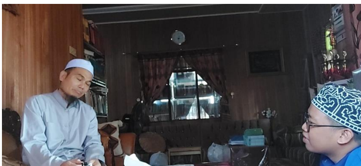
Wawan cara dengan Ustadz Gazali Mukeri LC Pimpinan Pondok Pesantren Manba'ul Ulum