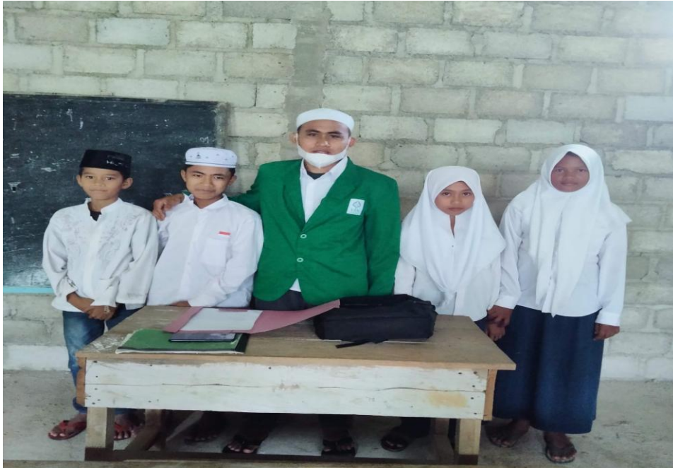
Foto bersama siswa