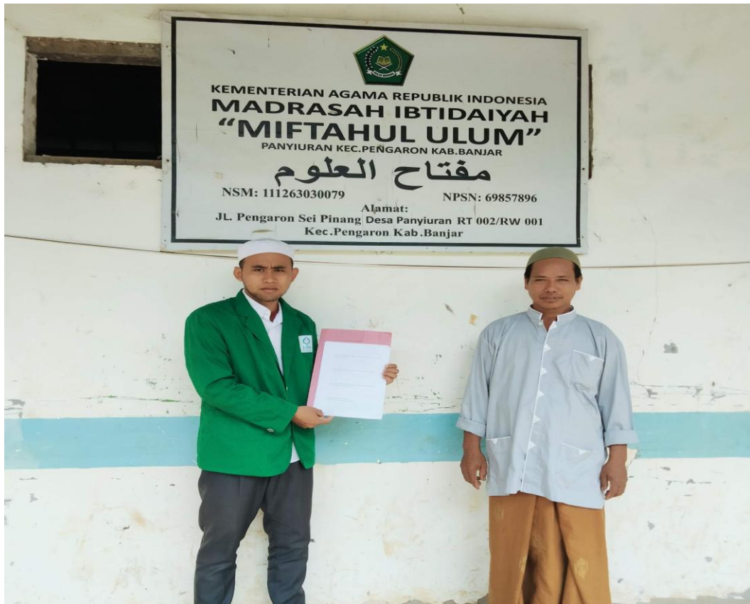
Foto bersma kepala sekolah