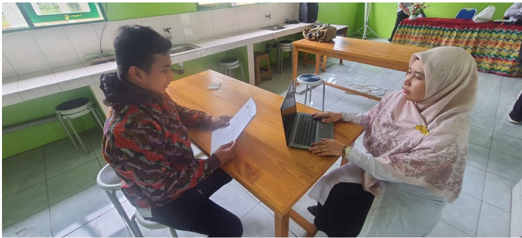
Wawancara dan Dokumentasi bersama Guru PAI KHA