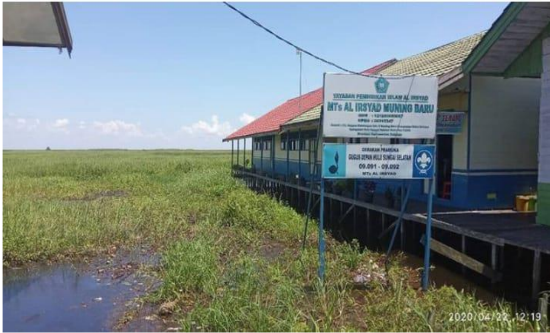
Penampakan MTs Al Irsyad