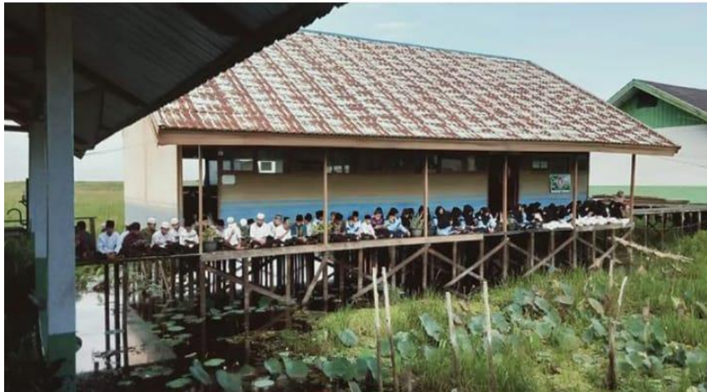
Kegiatan Baca Yasin setiap Pagi jum at