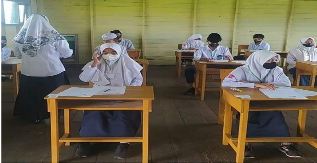
Ruang Kelas 9 saat Ujian