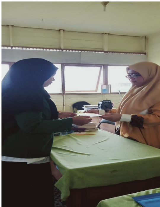
Menyerahkan Surat Riset Guru