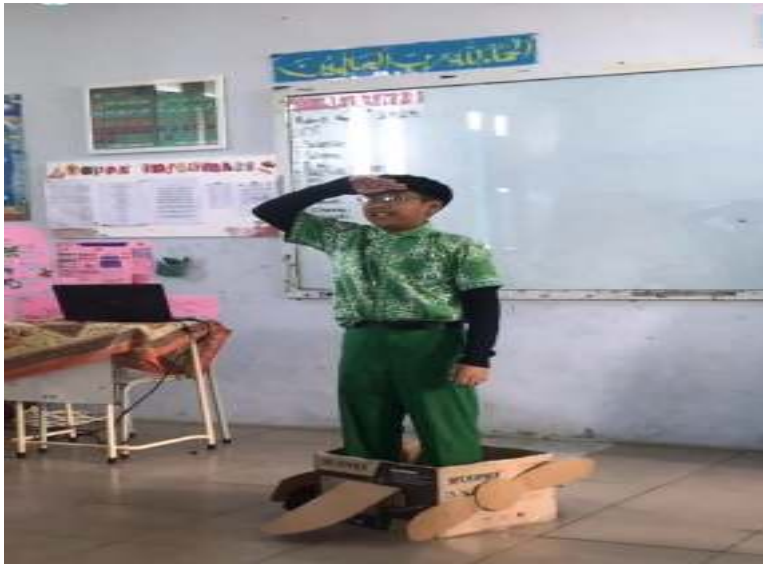
Dokumentasi Penelitian di Sekolah Penggerak SDN 1 Landasan Ulin Barat