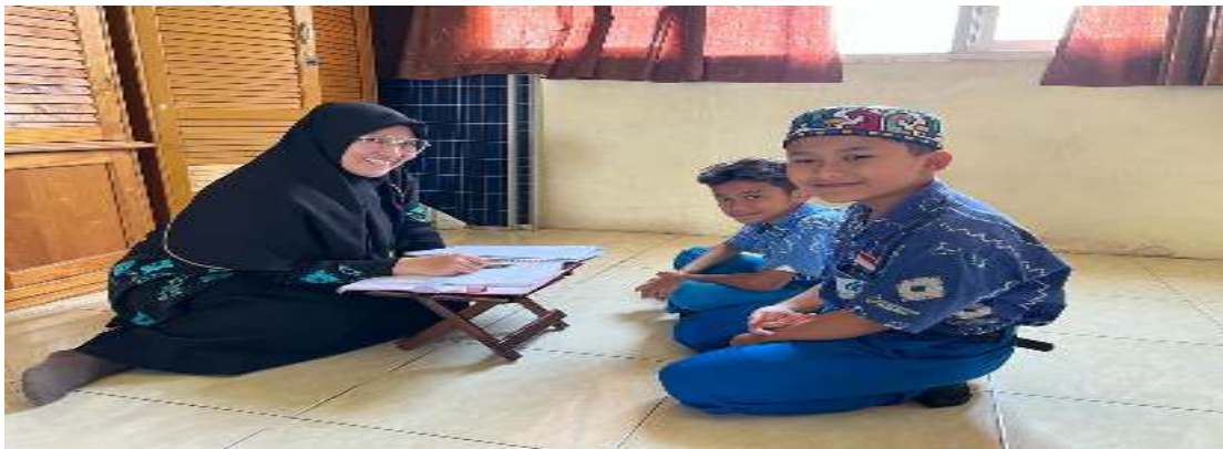
Bersama guru PAI-BP SDIT Robbani Banjarbaru