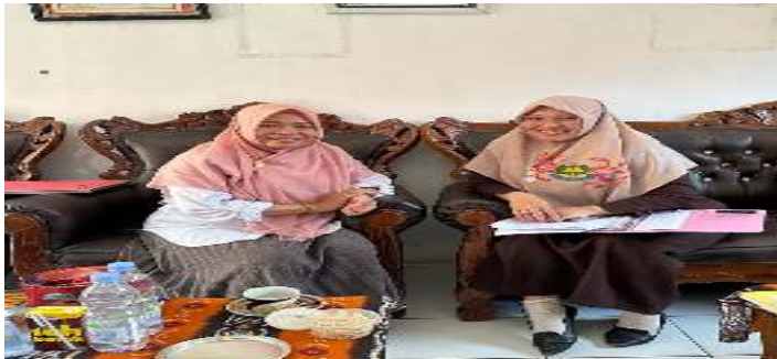
Bersama Peserta didik Kelas 4 tahun ajaran 2022/2023 SDN 1 Landasan Ulin Barat