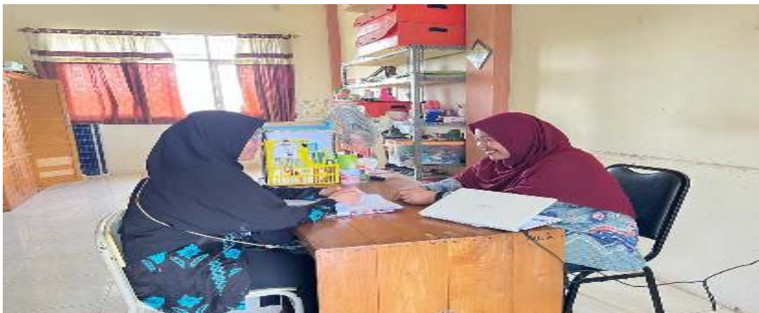
Dokumentasi Penelitian di Sekolah Penggerak SD Islam Al Azhar 37 Banjarbaru