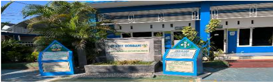
Kegiatan bina karakter SDIT Robbani