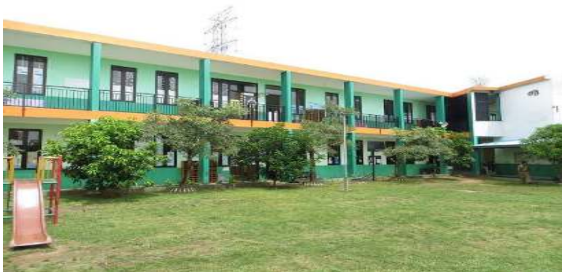
Bersama Kepala Sekolah SD Islam Al Azhar 37 Banjarbaru