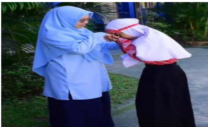
Bersama Wakil Kepala Sekolah Bagian kurikulum SDIT Robbani Banjarbaru