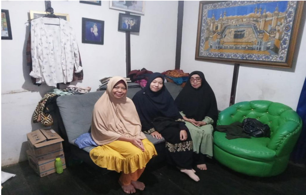
Wawancara dengan Sri (Masyarakat)