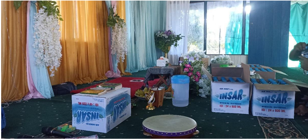
Meletakkan Hidangan atau sesaji pada ritual bamulud yang akan didoakan Sasaji bamulud