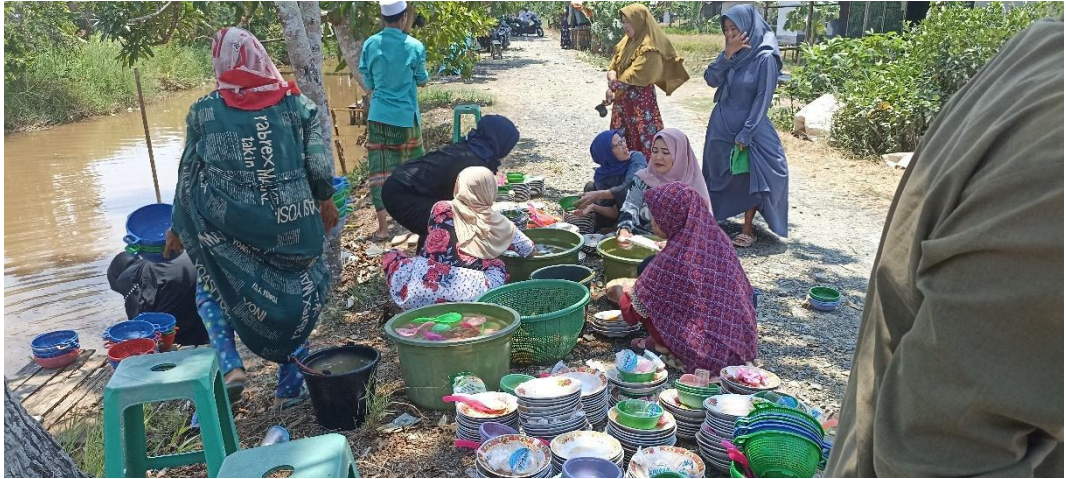
Kegiatan gotong royong