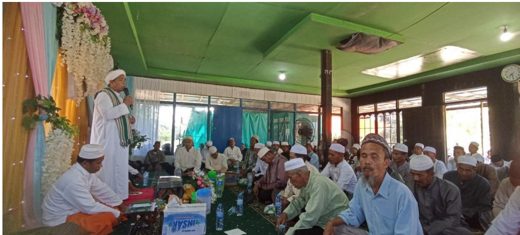
Penyampaian hikmah-hikmah pada ritual bammulud