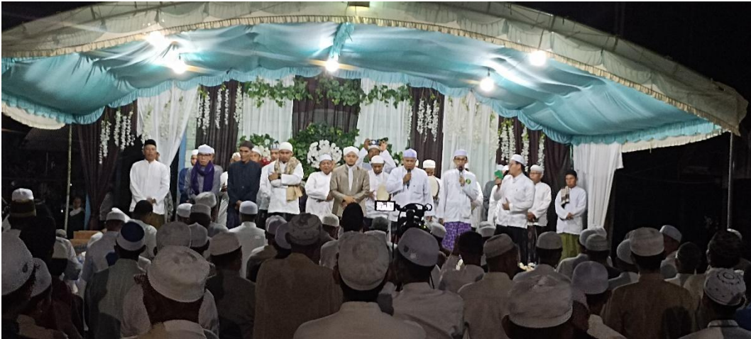
Kegiatan Asroqol (Mahalul Qiyam) pada ritual bamulud di tempat terbuka