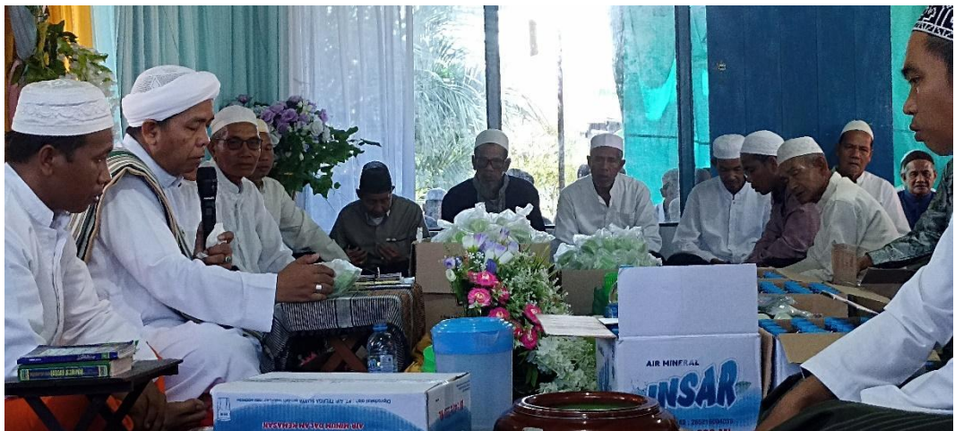
Pembacaan doa untuk sasaji