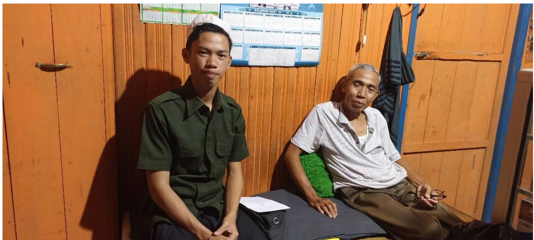
Peneliti bersama Guru Salam