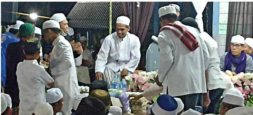
Kegiatan pemagan sesaji