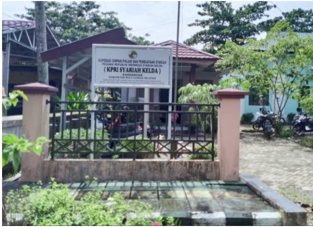
Lokasi penelitian KPRI Syariah Kelda