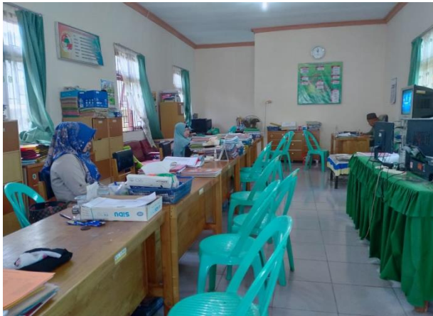
Suasana di dalam kantor KPRI Syariah Kelda