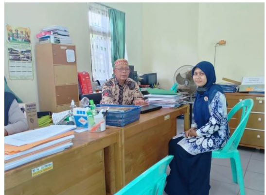
Wawancara dengan Ketua dan Sekretaris KPRI Syariah Kelda