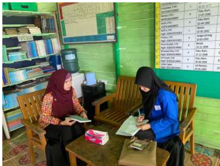
Wawancara dengan Siswa kelas IV