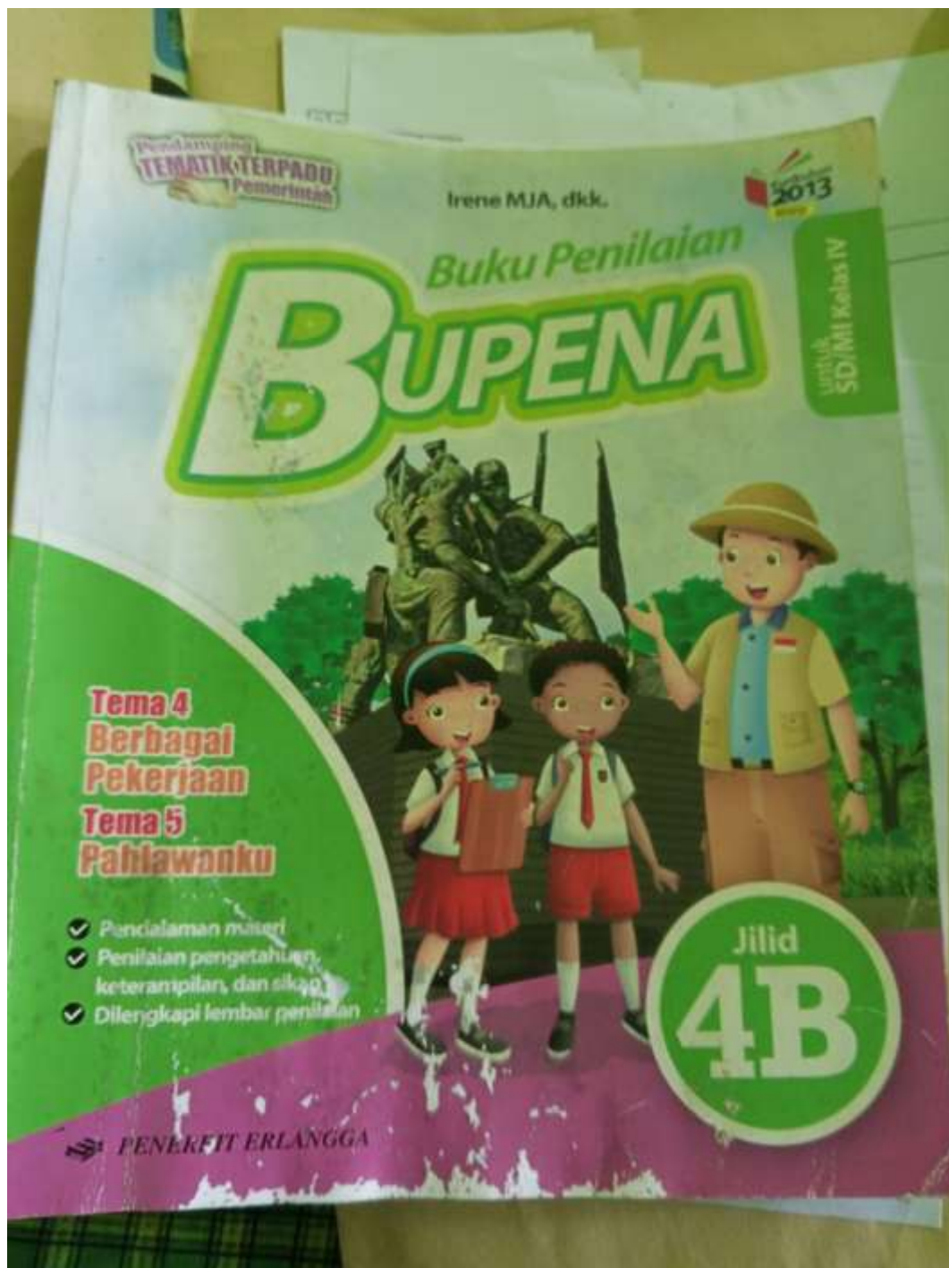
Lampiran III. Buku Ajar