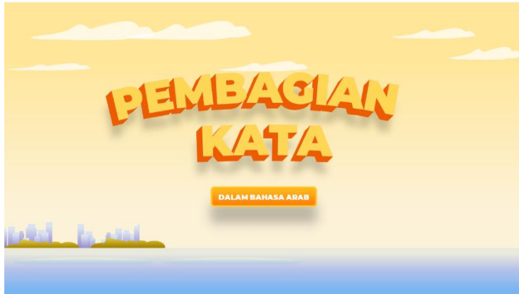
الصورة ١ العرض الافتتاحي