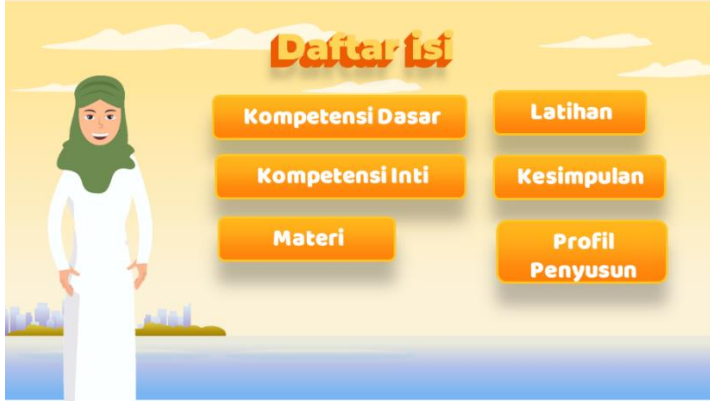
الصورة ٢ العرض المحتويات

تحتوي العرض الافتتاحي على موضوع المادة التي سيتم تقديمها بالإضافة إلى معلومات حول الفصل الذي تشير إليه المادة. (٢) المحتويات