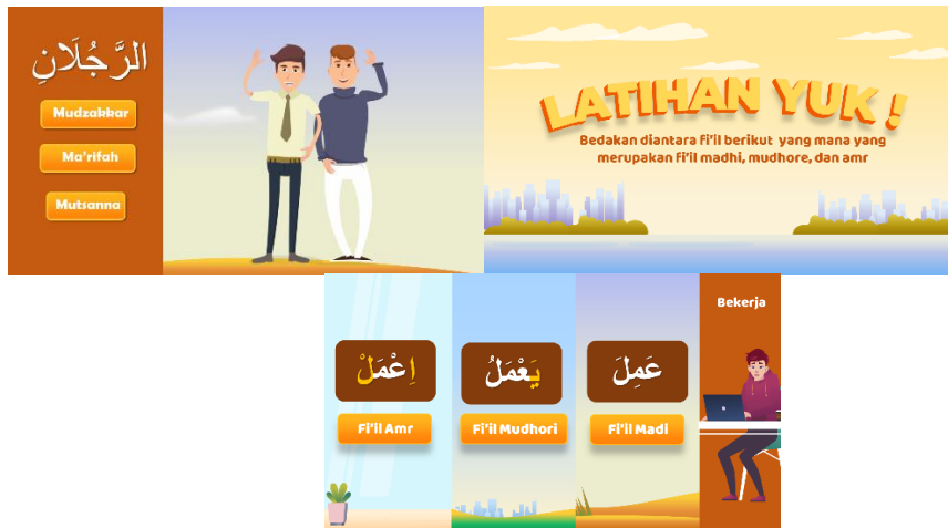
الصورة ٥ العرض التدريب

في جلسة التدريب هذه، يُطلب من الطلاب تحديد الكلمات التي تم ترتيبها في فئات تقسيم الملفات المناسبة خلال فترة ١٠ ثوانٍ. إذا مرت ١٠ ثواني،