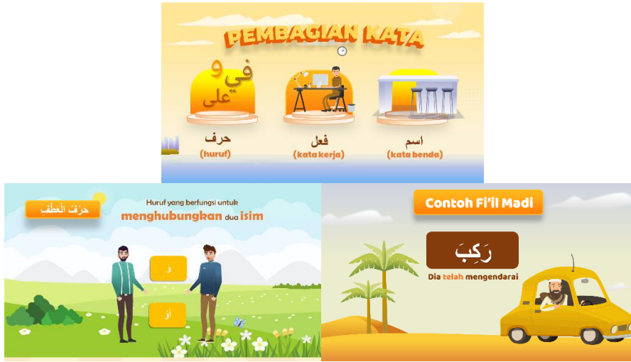
الصورة ٤ العرض المواد

عرض مادة القسمة أو الأفعال موضحة حسب الشخصيات في الرسوم المتحركة. يتم تقديم هذه المادة باستخدام الصور كوسيلة للتصور لتوضيح جميع مفاهيم التعلم، بما في ذلك خطوات التقسيم والتعاريف والأمثلة وخصائص كل عنصر من عناصر المادة التي تتم مناقشتها.