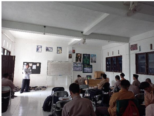
Keadaan di dalam kelas