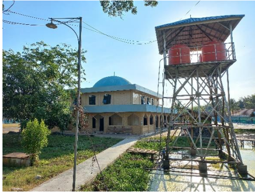
Masjid pondok pesantren