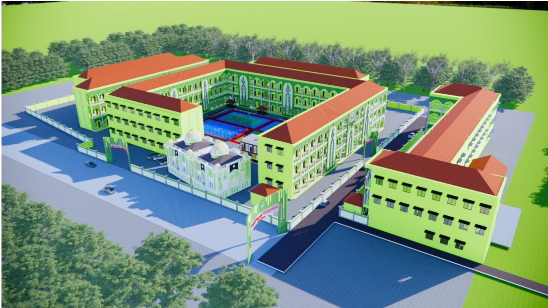
FOTO KEGIATAN PENELITIAN DAN KEADAAN DI PONDOK PESANTREN NURUL AMIN MBS MUHAMMADIYAH