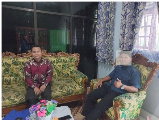
Wawancara dengan wakil direktur