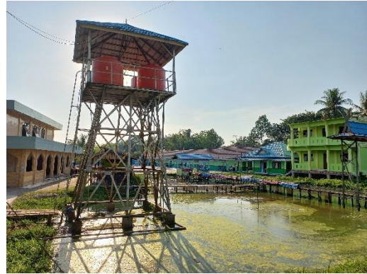
Keadaan pondok pesantren