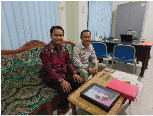
Wawancara dengan sekretaris umum