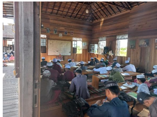
Kegiatan belajar yang terlihat dari dalam