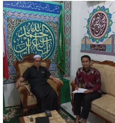
Wawancara dengan wakamat kurikulum