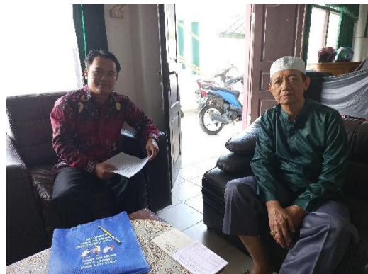
Wawancara dengan pihak yayasan