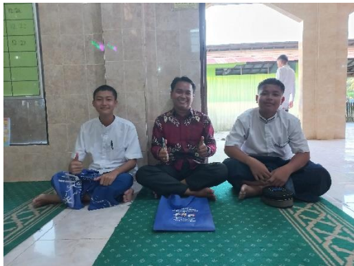
Wawancara dengan santri