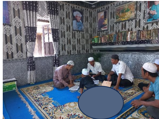
Penerimaan santri baru