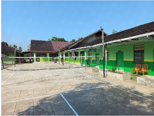
Rumah ustadz/ah dan purna santri