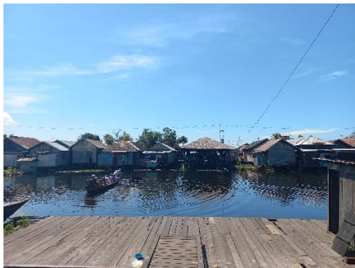
Akses menuju pondok