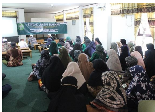
Kegiatan pelatihan, pengembangan, seminar dan evaluasi