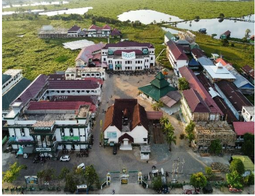
Pondok pesantren saat ini