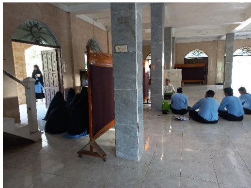
Kegiatan belajar mengajar di masjid