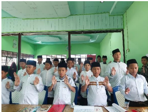
Pembinaan awal santri baru