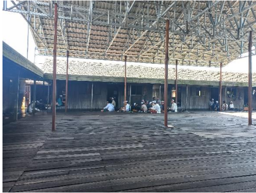
Keadaan pondok dari luar