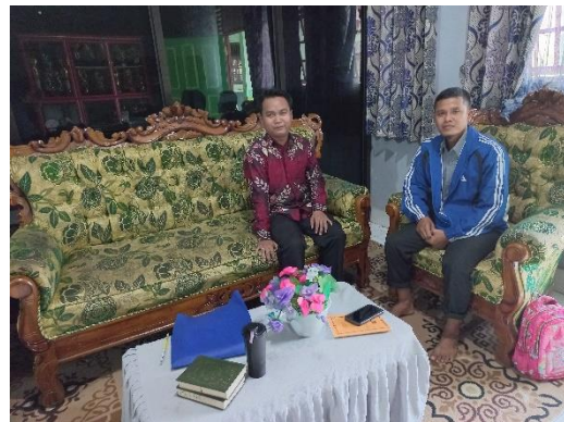
Wawancara dengan Ustadz sekaligus sekretaris