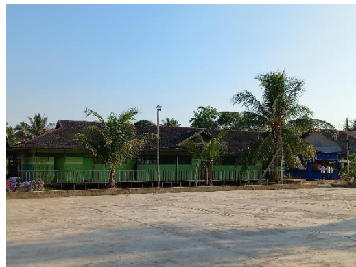
Ruang kelas milik pondok pesantren