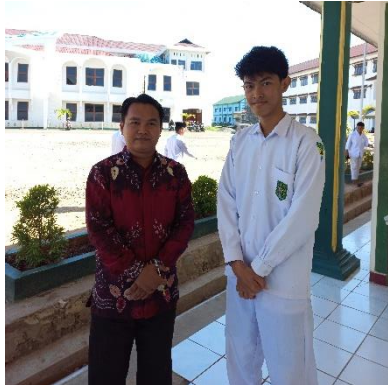
Wawancara dengan salah satu santri