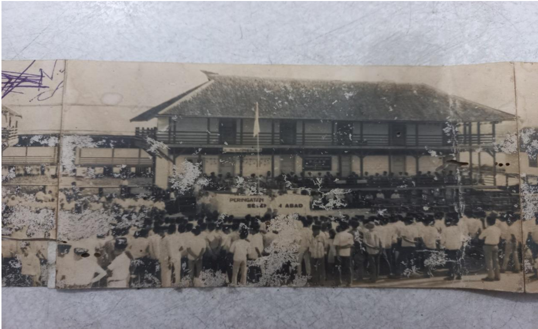
FOTO KEGIATAN PENELITIAN DAN KEADAAN DI PONDOK PESANTREN RASYIDIYAH KHALIDIYAH