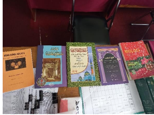
Buku dan kitab