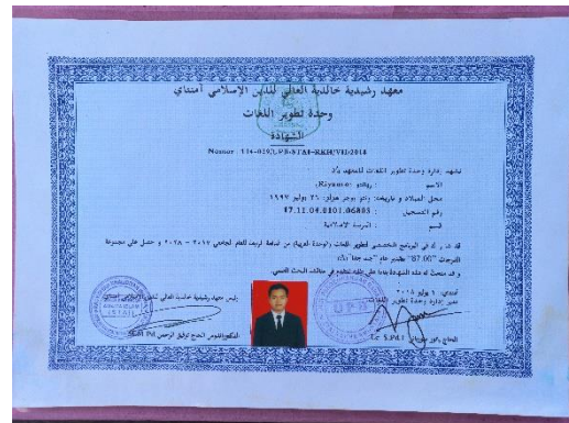
Ijazah pondok pesantren