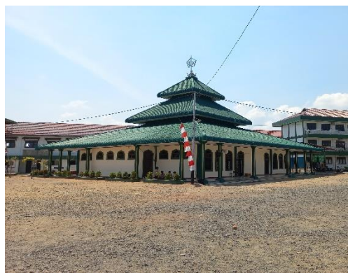
Masjid pusat pondok pesantren