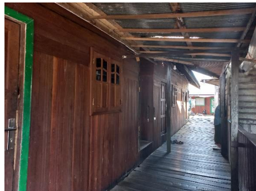
Akses jalan menuju asrama