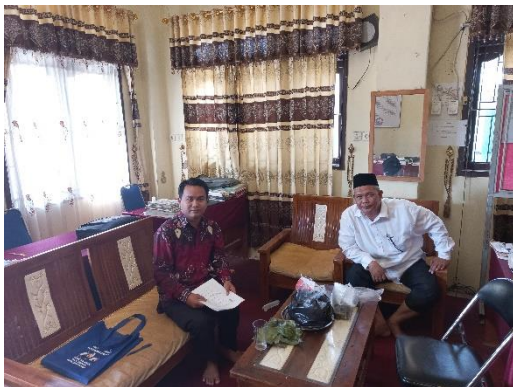
Wawancara dengan salah satu pengajar