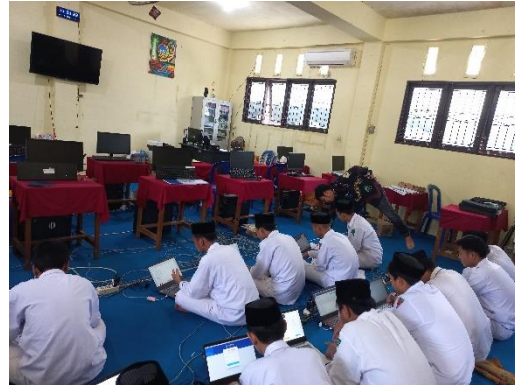
Kegiatan di Laboratorium TIK