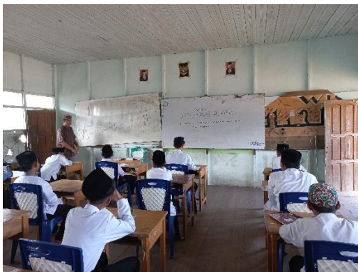
Kegiatan belajar mengajar