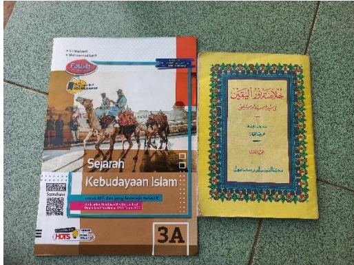
Kitab dan buku yang digunakan