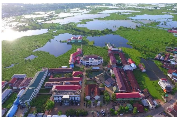
Bangunan pondok pesantren