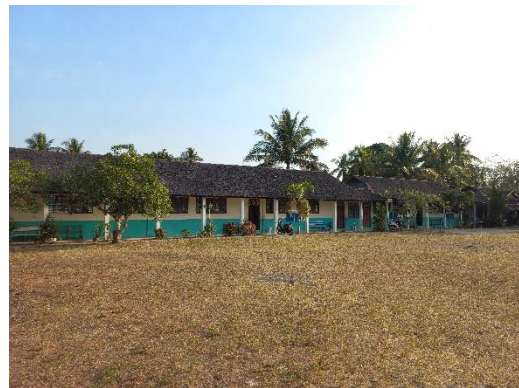
Ruang kelas milik muallimin