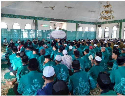
Kegiatan di dalam masjid