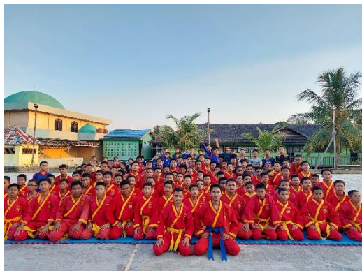
Ektrakulikuler tapak suci