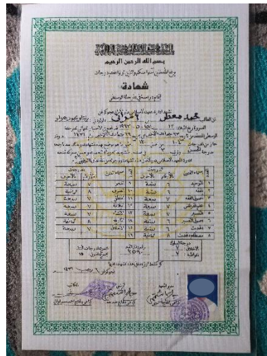
Ijazah pondok pesantren