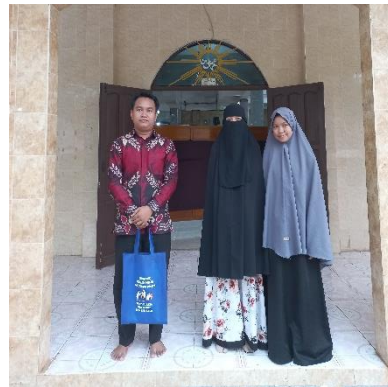
Wawancara dengan ustadzah