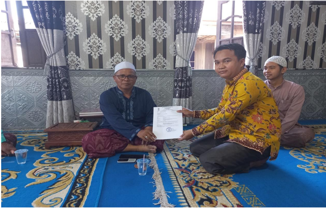
FOTO KEGIATAN PENELITIAN DAN KEADAAN DI PONDOK PESANTREN DARUL AMAN