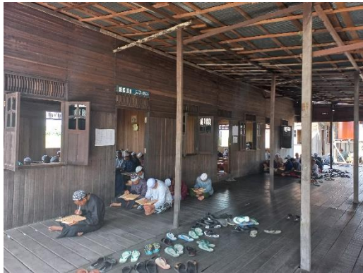
Kegiatan belajar yang terlihat dari luar