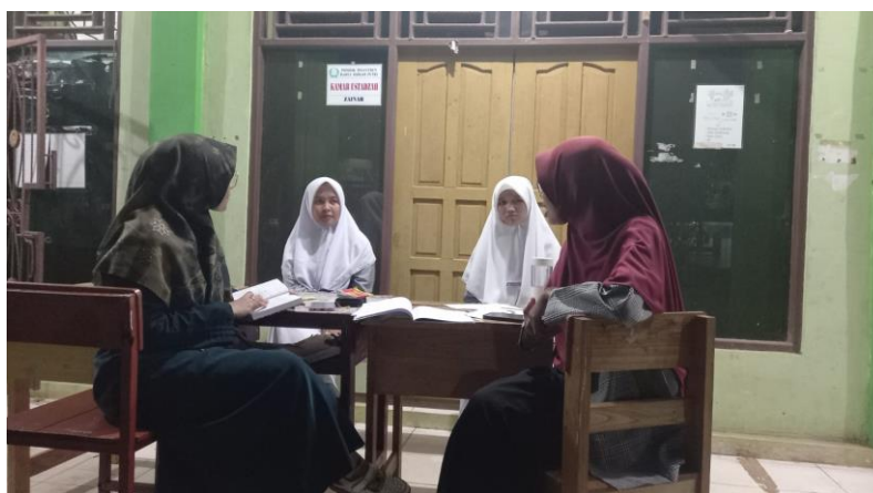
صورة ٣ مقابلة مع المعلمة من قسم اللغة