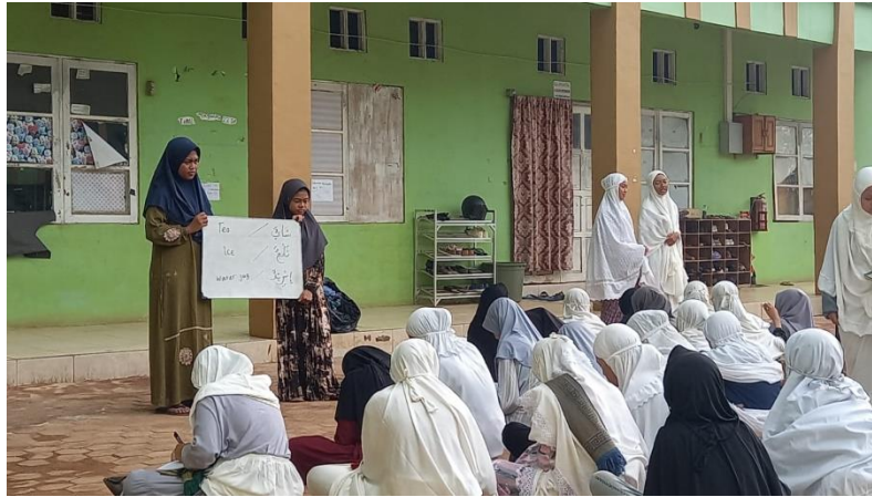
صورة ٢ المفردات الصباحية للطالبات الجدد