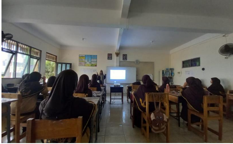
صورة ١ أنشطة تعليم اللغة العربية في الصف السابع